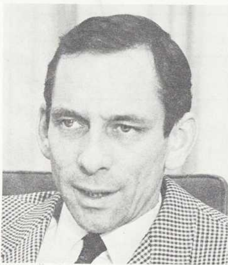
le 27 janvier M. Jean Cournoyer ministre des richesses naturelles

DEP PERIODIQUES BIBLIO NAT90. 1700 RUE ST-DENIS MONTREAL PQ H2X 3K6 TREAL merce Hall 12Z 1T1 761 808 2661