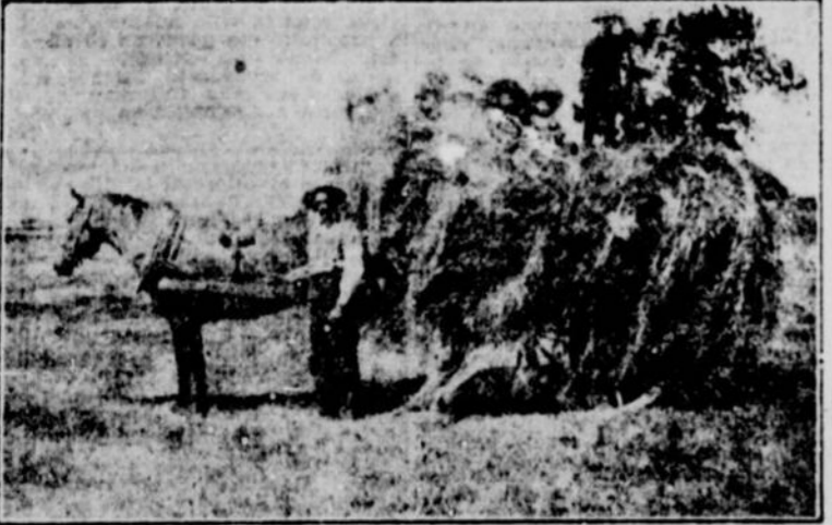
La récompense: la récolte du foin à laquelle collaborent tous les membres de la famille heureuse du colon.

Au cours de la description trop sommaire de nos magnifiques régions de colonisation, il a été soulevé question des conditions exceptionnelles qu'elles offrent aux colons étrangers, et plus spécialement aux Français et aux Belges qui ont déjà des points de contact avec le peuple canadien-français. Il ne faudrait pourtant pas croire que cette invitation est exclusive. Evidemment, si les grandes régions de colonisation offrent des perspectives d'avenir aux colons et aux cultivateurs du midi de l'Europe, ces alléchantes perspectives, ou mieux, ces garanties d'avenir demeurent les mêmes pour ceux de nos compatriotes que l'esprit d'entreprise ou des circonstances que nous n'avons pas à apprécier, ont portés de l'autre côté de la ligne 45e. Ce n'est pas manquer à la vérité, ni présenter un fait nouveau que de dire qu'une foule de Canadiens-Français de la Province de Québec, séduits par les apparences ou peut-être par des annonces trompeuses, ont gagné la terre