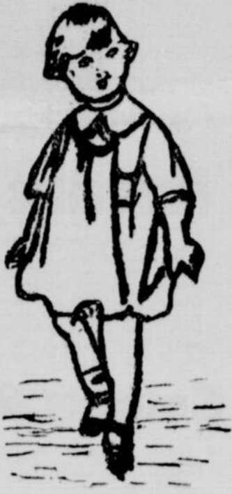
(Envoi de Fernande Roy)