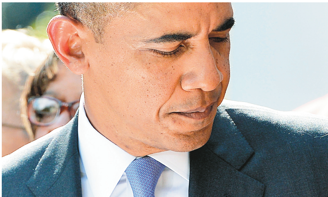
Barack Obama pendant la crise budgétaire au début d'octobre