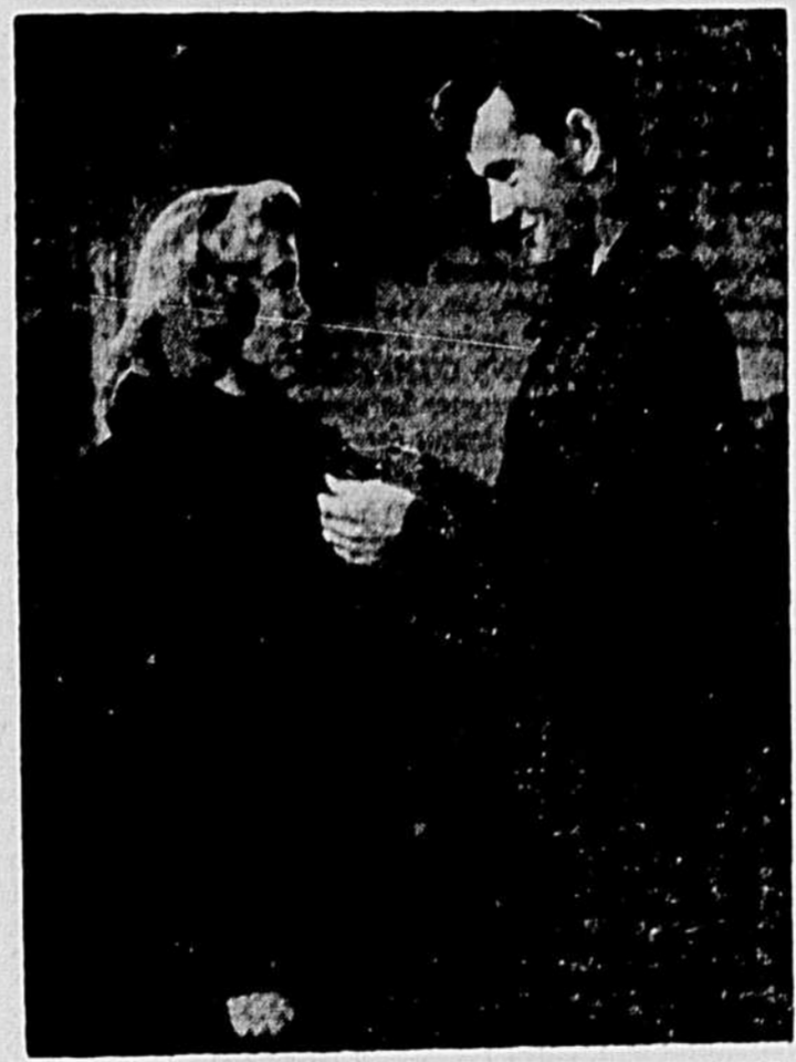
June Allyson et Robert Walker, en vedette dans la comédie "THE SAILOR TAKES A WIFE", à l'écran du Capitol.