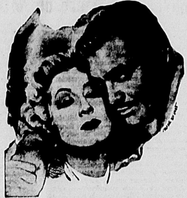
Clark Gable et Greer Garson, les grands artistes qui se partagent la vedette du film "ADVENTURE", au Loew's.