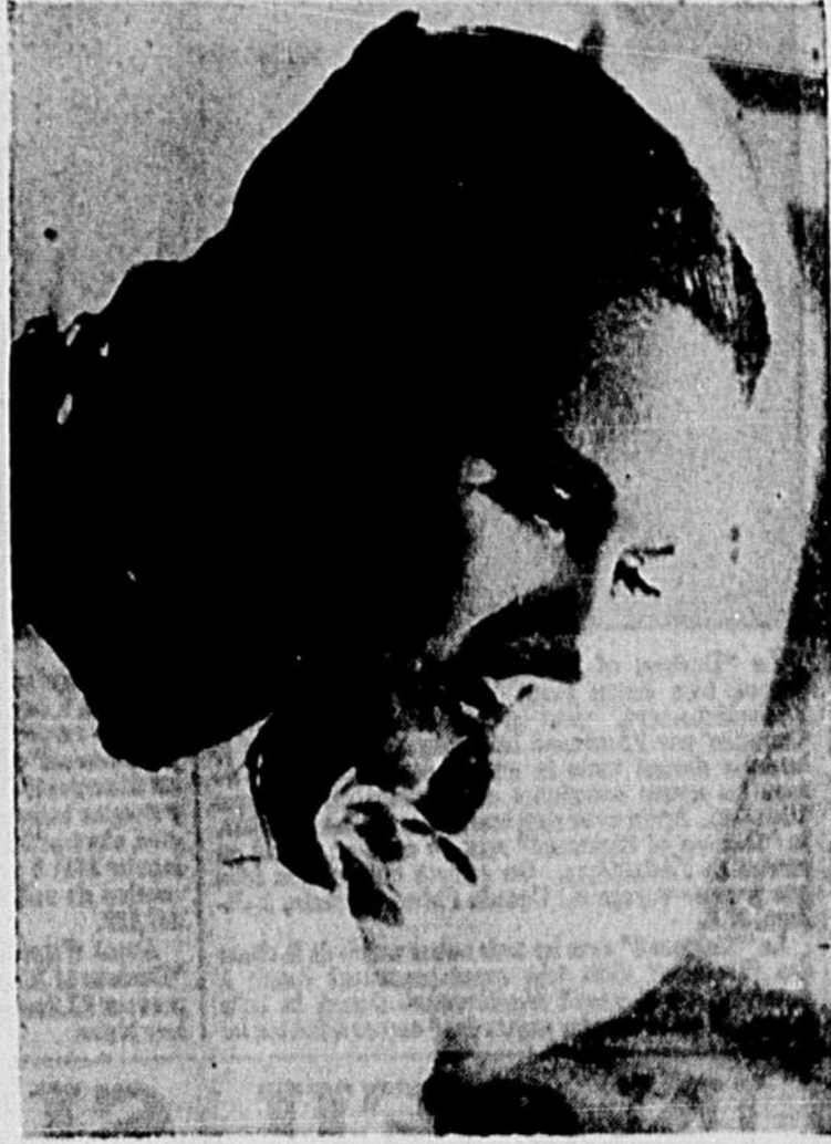
Ann Todd, la belle vedette du film "THE SEVENTH VEIL", qui prend l'affiche au palace.

La psychiatre entre cependant en jeu, et rendra confiance à la jeune musicienne. Comme on le devine, la musique joue un rôle important dans cette magnifique production qui nous présente plusieurs des plus belles œuvres du piano.