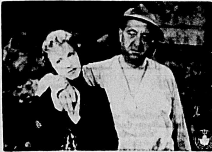
Josette Day et le formidable artiste Raimu dans une scène du film de Pagnol, 'LA FILLE DU PUISATIER' qui poursuit son énorme succès en 9e semaine au Cinéma de Paris.