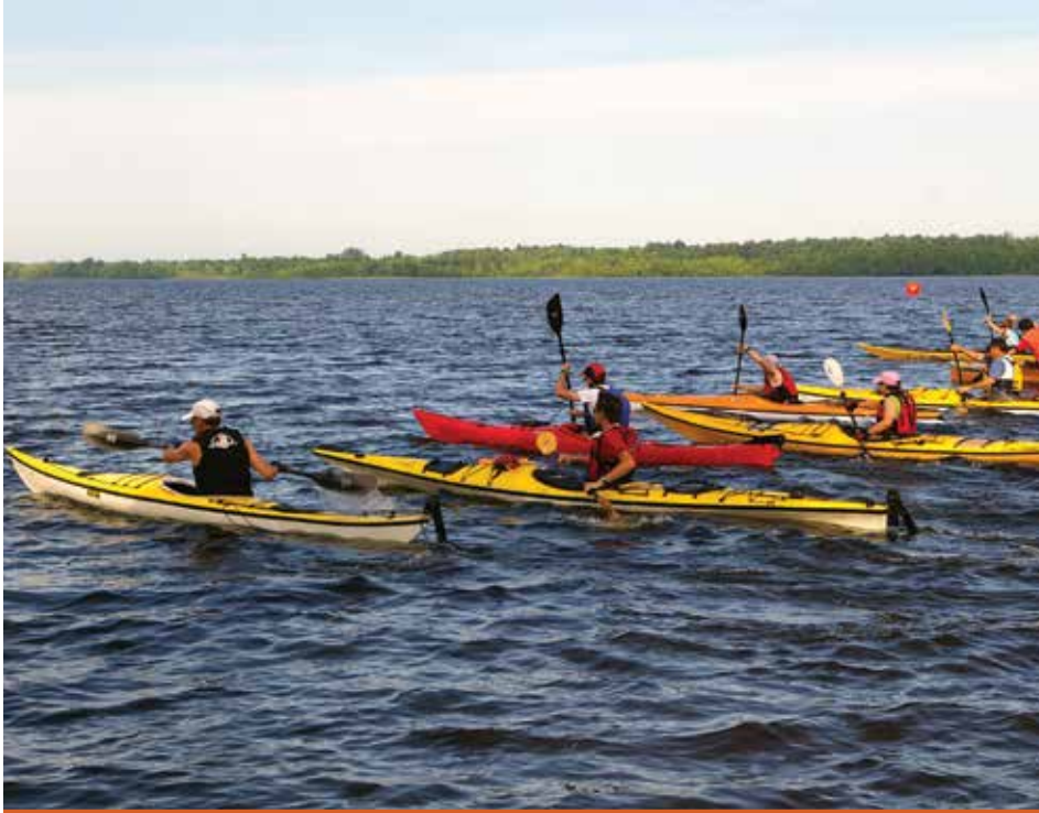
Kayaks sur le fleuve Saint-Laurent