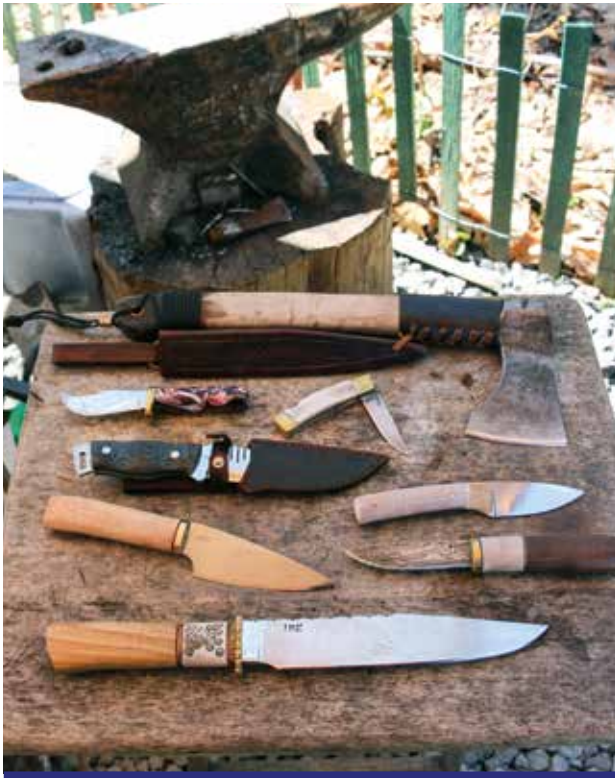
Les couteaux et étuis de William Mary-Pouliot sont des pièces uniques en leur genre.

Pour la production des lames, il utilise de l'acier carbone, car, explique-t-il, le carbone contribue à garder plus longtemps leur côté tranchant en plus de faire en sorte qu'elles ne rouilleront pas facilement. Les manches des couteaux sont faits de bois de certaines espèces d'arbre, de bois de cerf de Virginie, d'acrylique G-10 (genre de plastique) ou du même métal que les lames. Le manche de l'un de ses premiers couteaux a été fait avec le bois d'un cerf mort qu'il a trouvé au cours d'une de ses ex-