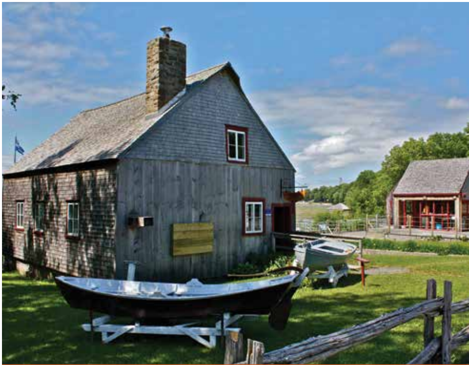
Le Parc maritime de Saint-Laurent

Depuis peu, le Parc maritime vous offre la possibilité de devenir membre