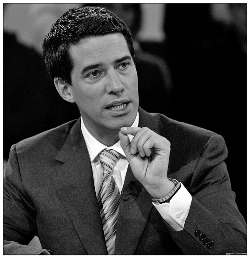
Devant Guy A. Lepage et les caméras de Tout le monde en parle, le ton d'André Boisclair était moins pompeux. Et l'homme avait plus d'humanité que d'habitude.

Mathieu Ricard est le fils de l'académicien Jean François Revel et aurait pu faire une grande carrière en France. Mais il est parti au Tibet et a découvert une sagesse qui lui donne un bonheur quotidien. Et de la compassion