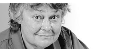
LOUISE COUSINEAU TÉLÉVISION

J'ignore ce que penseront les experts en politique de la performance d'André Boisclair hier soir à Tout le monde en parle , mais moi, peu attirée par les discours officiels et les jambettes des campagnes électorales, je l'ai trouvé plutôt intéressant.