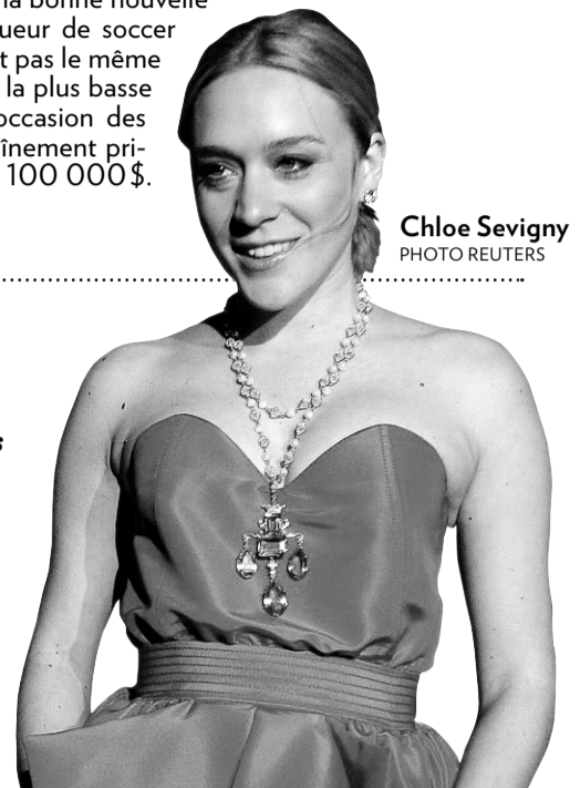
Chloe Sevigny

C'est l'histoire de deux stars anglaises qui déménagent à Los Angeles, sans doute dans l'espoir de donner un nouvel élan à leur popularité. Eh bien, ça commence bien pour l'une... et moins bien pour l'autre. Résumons. Variety a annoncé la semaine dernière que Victoria Beckham avait signé un lucratif contrat avec NBC qui fera d'elle la vedette d'une télé-réalité de six épisodes sur son déménagement dans la Cité des anges, justement. Ça, c'est la bonne nouvelle (enfin, ça dépend pour qui). De son côté, David Beckham, joueur de soccer adulé en Europe, a sans doute enfin compris que son sport n'avait pas le même impact chez nos voisins du Sud. C'est lui, en effet, qui a obtenu la plus basse mise lors d'une soirée caritative organisée par Elton John à l'occasion des Oscars. Il a recueilli moins 70 000 $ contre une séance d'entraînement privée alors que presque toutes les autres stars ont obtenu plus de 100 000 $. Qui, d'après vous, attirera le plus de paparazzi?