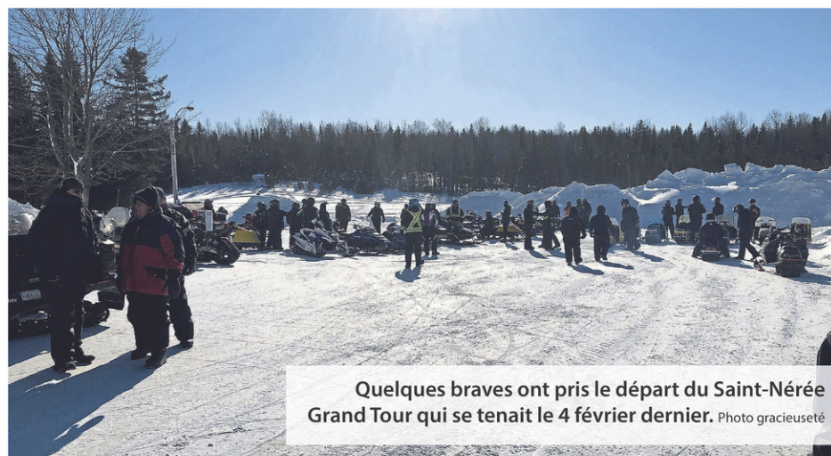
Quelques braves ont pris le départ du Saint-Nérée Grand Tour qui se tenait le 4 février dernier.

Pour ce qui est de la randonnée en elle-même, incluant le souper, M. Fournier a mentionné qu'un bilan complet devait être effectué, mais qu'il était