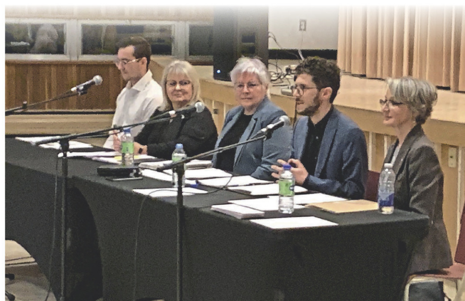
Table des intervenants ayant pris la parole au cours de l'assemblée publique d'information sur l'avenir du Collège de Saint-Damien.