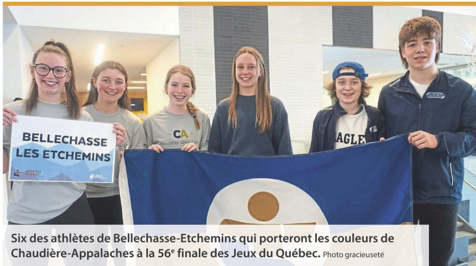
Six des athlètes de Bellechasse-Etchemins qui porteront les couleurs de Chaudière-Appalaches à la 56 e finale des Jeux du Québec.

Une collecte de sang d'Héma-Québec aura lieu le jeudi 9 mars de 14h30 à 20h au Centre communautaire de Saint-Lazare. Objectif: 90 donneurs. Sur rendez-vous seulement au hema-quebec.qc.ca ou sans frais au 1 800 343-7264.