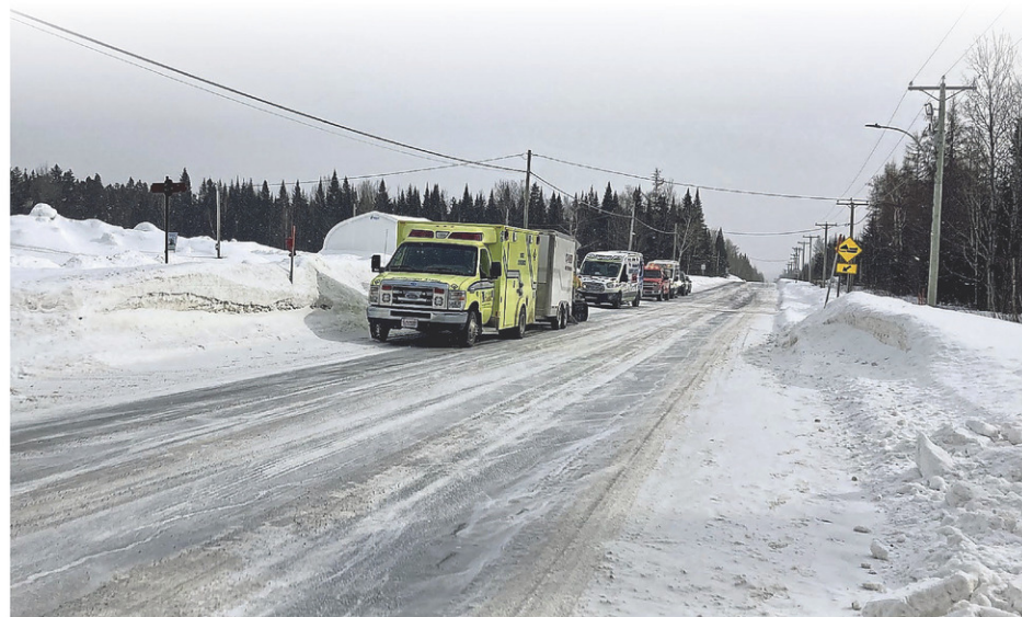
L'intervention s'est déroulée sur la route 55, à proximité de l'intersection de la rue Principale à Sainte-Sabine.

une partie du contenu avec deux tracteurs et arroser le contenu en continu sous une température de -25 degrés », indique M. Boutin qui ajoute que des sapeurs de Saint-Charles et le service de cascades, basé à Honfleur, ont été appelés en entraide.