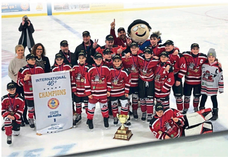
Les Castors Pee-Wee B de Pro-Lac ont récemment remporté le titre dans la catégorie M13-B1, lors du 46e Tournoi international BSR de Lévis.

La saison de tournois étant terminée pour eux, les jeunes Etcheminois profiteront du reste de la saison régulière pour se préparer en vue du tournoi de fin de saison de la LHMCA, puis des championnats régionaux de la discipline dont le lieu reste toutefois à déterminer.