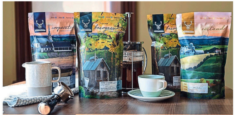
Les emballages de café de la Microbrasserie de Bellechasse, dont le visuel est conçu par la firme Rootree Design, ont été primés à New York.

« Nous voulions que nos clients ramènent leur pochette de café chez eux et qu'ils puissent se remémorer les moments agréables