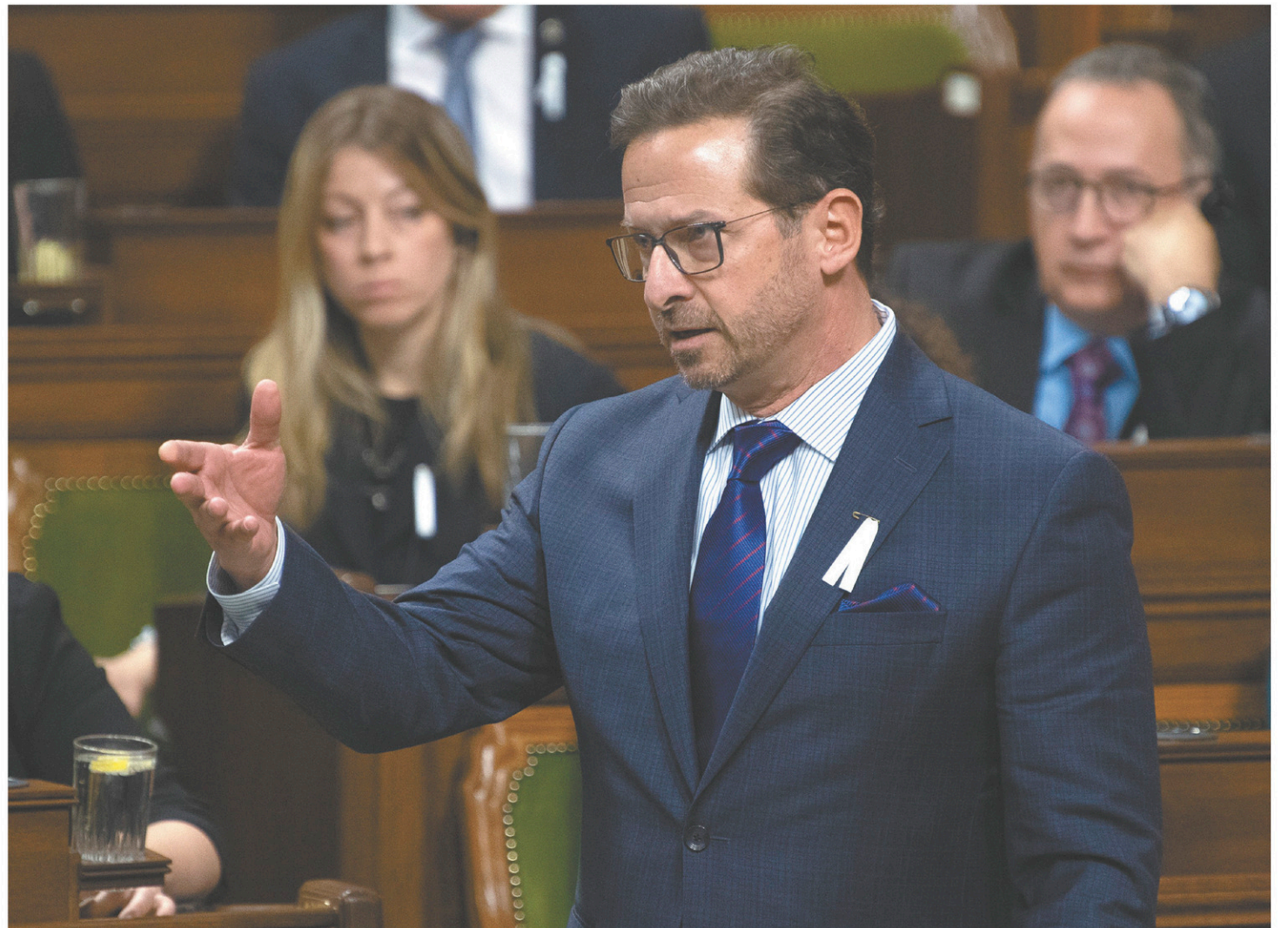
Après avoir appuyé le discours du Trône, le chef bloquiste, Yves-François Blanchet, a indiqué lundi qu'il votera pour la baisse d'impôt que les libéraux veulent instaurer le 1 er janvier prochain.

D'ailleurs, le Bloc a demandé lundi que le congé de maladie auquel les travailleurs cotisant à la caisse d'assurance-emploi ont droit passe de 15 à 50 semaines. Les libéraux se sont engagés en campagne à le porter à 26 semaines.