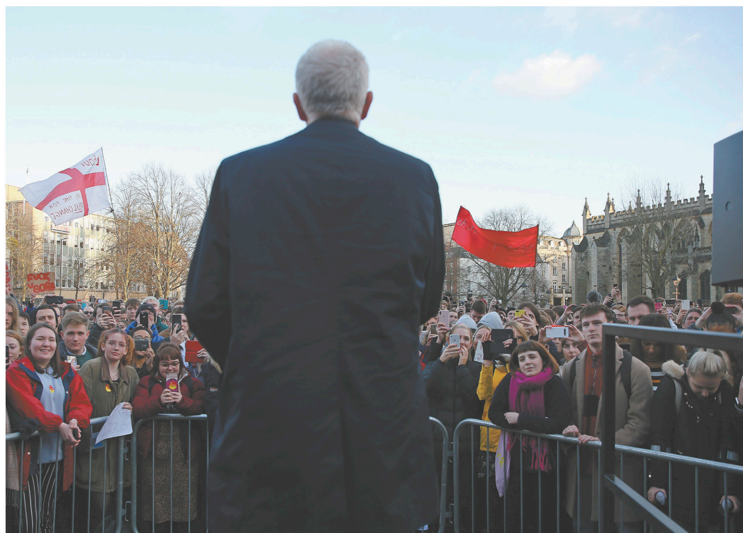
Les foules ne sont plus au rendez-vous comme en 2015 dans les grands rassemblements publics que Jeremy Corbyn aime tant.

La Russie exclue des Jeux olympiques pour quatre ans | B 6