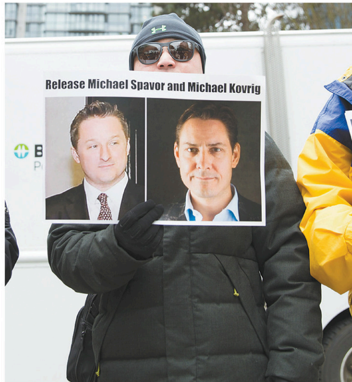
Michael Spavor et Michael Kovrig sont détenus en Chine.

« Bien que la Chine n'ait jamais détaillé les raisons pour lesquelles Michael [Kovrig] est emprisonné, il est clair qu'il n'est qu'un pion dans une lutte géopolitique plus large », déplorait la semaine dernière son patron à l'International Crisis Group, Robert Malley, dans le Washington Post . M. Malley estime que Michael Kovrig est victime de la guerre commerciale que se livrent la Chine et les États-Unis, ainsi que de l'arrestation au Canada de la dirigeante financière du géant des télécommunications Huawei, Meng Wanzhou — qui fait face à une demande d'extradition des États-Unis. M me Meng a été arrêtée le 1 er décembre 2018 — neuf jours avant