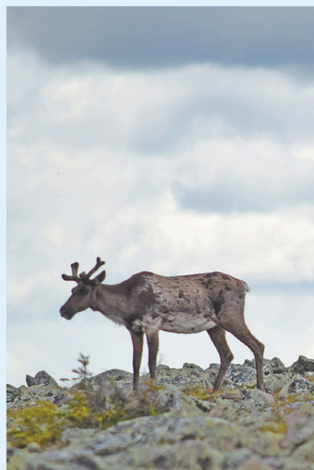
Un caribou aperçu en Gaspésie ALEXANDRE SHIELDS LE DEVOIR