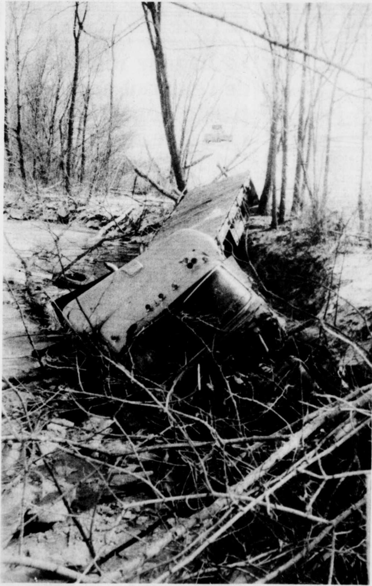
Après avoir quitté l'autoroute, le camion a fait tombé dans la rivière. Le conducteur s'en est tiré sans mal.