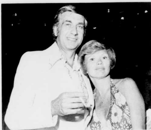
Janette Bertrand et Jean Lajeunesse, auteurs et vedettes de la série Quelle famille!