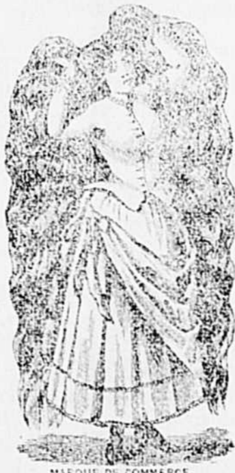
MARQUE DE COMMERCE.

Robson rend aux cheveux leur noir primitif, mais il possède de plus la précieuse propriété de les assouplir et de leur donner un lustre incomparable. Essayez ce Restaurateur, et vous serez pleinement satisfait. Prix 50 cts la bouteille. Vendu chez tous les marchands et chez L. ROBITAILLE, Pharm, Joliette.