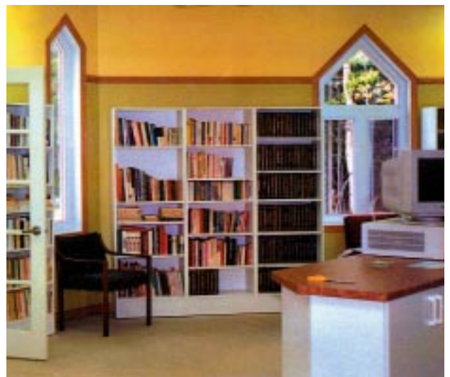
La bibliothèque du Camp Papillon a été inaugurée le 26 août 2001.