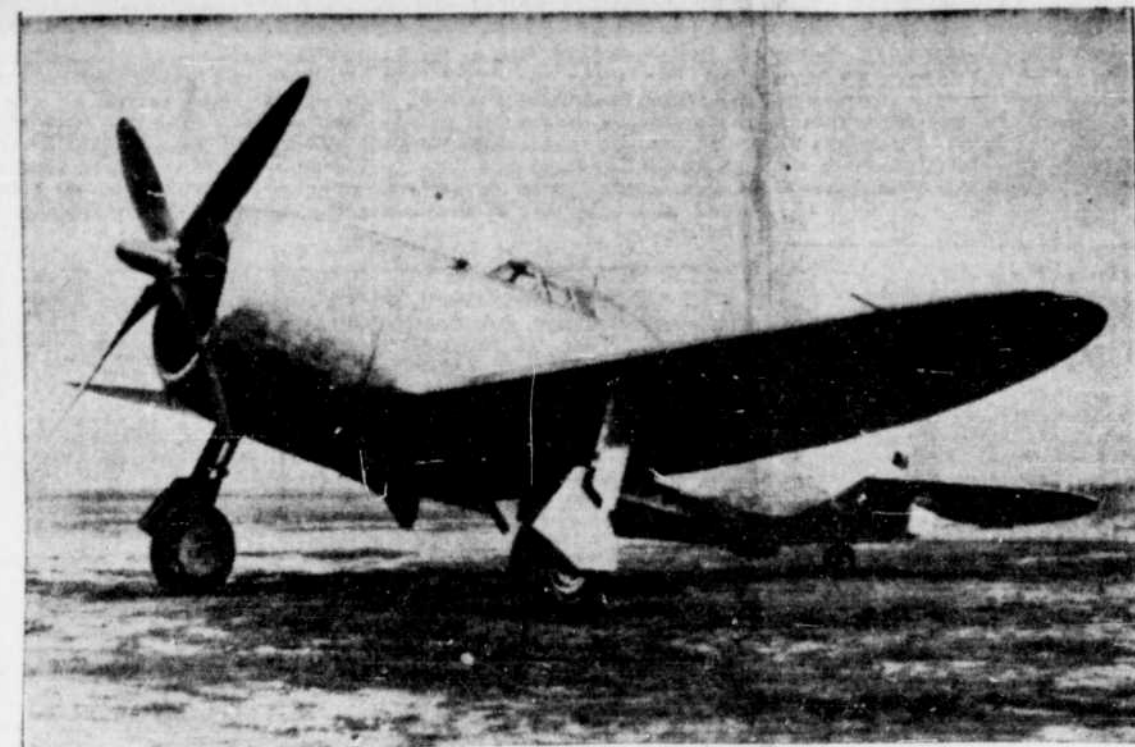
Voici le plus rapide avion de combat du monde, le Thunderbolt P-47, qui a atteint la vitesse en plongeon, de 680 milles à l'heure et 400 milles sur le plan horizontal; les usines américaines en feront la fabrication sur une haute échelle bientôt. Cet avion possède un moteur d'une puissance de 2,000 c.v. avec une hélice à quatre rates, il mesure 32 pieds de long; son envergure est de 41 pieds. On ne révèle pas la puissance de son tir, mais on dit qu'il est puissamment armé de canons à petits et à gros calibres.