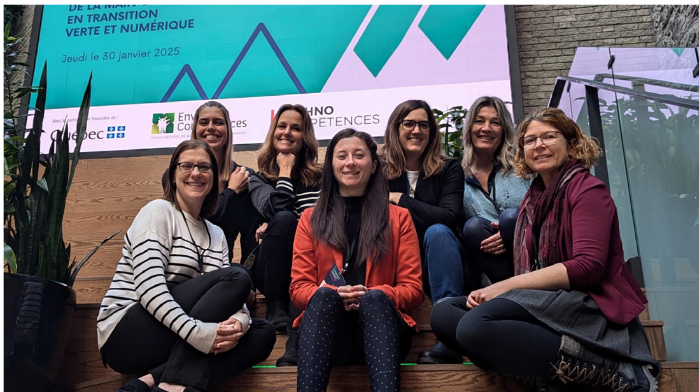
L'équipe d'HortiCompétences participait au Sommet de la main-d'œuvre en transition verte et numérique.

En plus de collaborer à divers ateliers de travail ou de consultation des pôles, HortiCompétences a participé aux travaux du grand diagnostic vert (GDV), coordonné par le pôle d'expertise en transition verte. Ce projet visait à mesurer la maturité des différents secteurs d'activités économiques en lien avec la transition verte et la main-d'œuvre, par le biais des 29 comités sectoriels de main-d'œuvre. L'équipe était présente au dévoilement des résultats et des recommandations du GDV, lors du Sommet de la transition verte et de la transition numérique 2025 et a ainsi pu prendre toute la mesure des enjeux liés à ces transitions, pour bien accompagner les entreprises, en collaboration avec les acteurs clés du secteur.