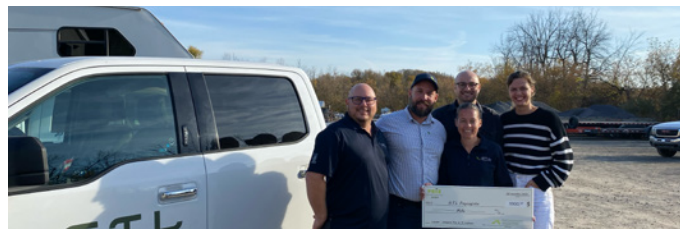
CATÉGORIE 15 EMPLOYÉS ET PLUS : GTL PAYSAGISTE

Initiative : Pour développer davantage la synergie au sein de son équipe, l'entreprise Candide Villeneuve Paysagiste a organisé des activités conviviales sur les lieux de travail, notamment à l'heure du dîner, avec des barbecues et des jeux comme le volleyball. De plus, des sorties de groupe ont permis aux employés de se retrouver en dehors du cadre professionnel. Les liens tissés pendant la saison perdurent grâce, entre autres, à des activités hors saison durant l'hiver.