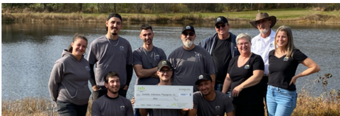
CATÉGORIE 1 À 15 EMPLOYÉS : CANDIDE VILLENEUVE PAYSAGISTE

Initiative : Pour développer davantage la synergie au sein de son équipe, l'entreprise Candide Villeneuve Paysagiste a organisé des activités conviviales sur les lieux de travail, notamment à l'heure du dîner, avec des barbecues et des jeux comme le volleyball. De plus, des sorties de groupe ont permis aux employés de se retrouver en dehors du cadre professionnel. Les liens tissés pendant la saison perdurent grâce, entre autres, à des activités hors saison durant l'hiver.