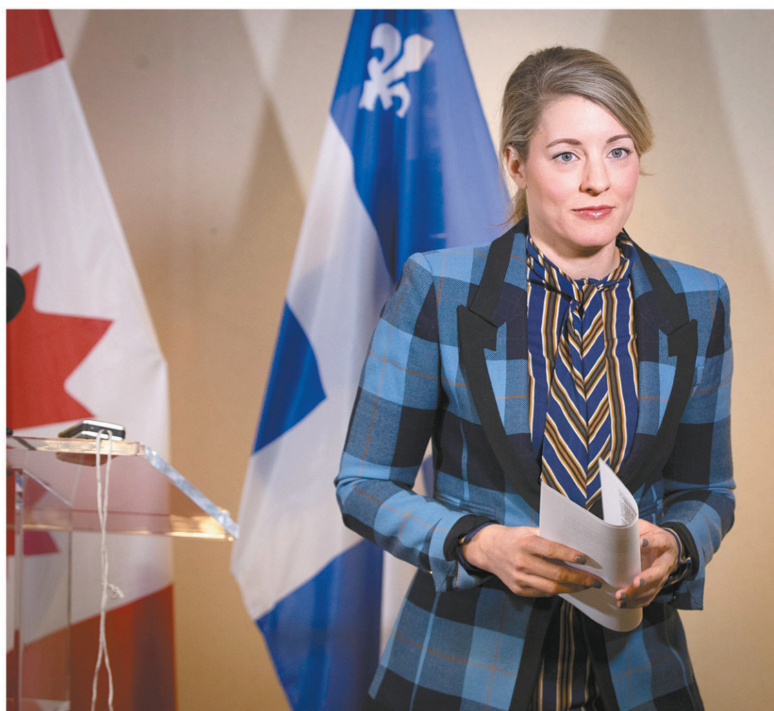
La ministre du Patrimoine, Mélanie Joly, revient de la Silicon Valley, où elle a pu faire part des attentes du Canada à l'égard des géants du Web.

Devant des intervenants de tous les horizons (experts du monde numérique, représentants du milieu culturel ou de compagnies comme Facebook), Mélanie Joly a défendu l'importance du concept de diversité culturelle, à l'heure où quelques grands joueurs contrôlent l'essentiel de la diffusion culturelle en ligne. Ce n'était pas sa première intervention du genre,