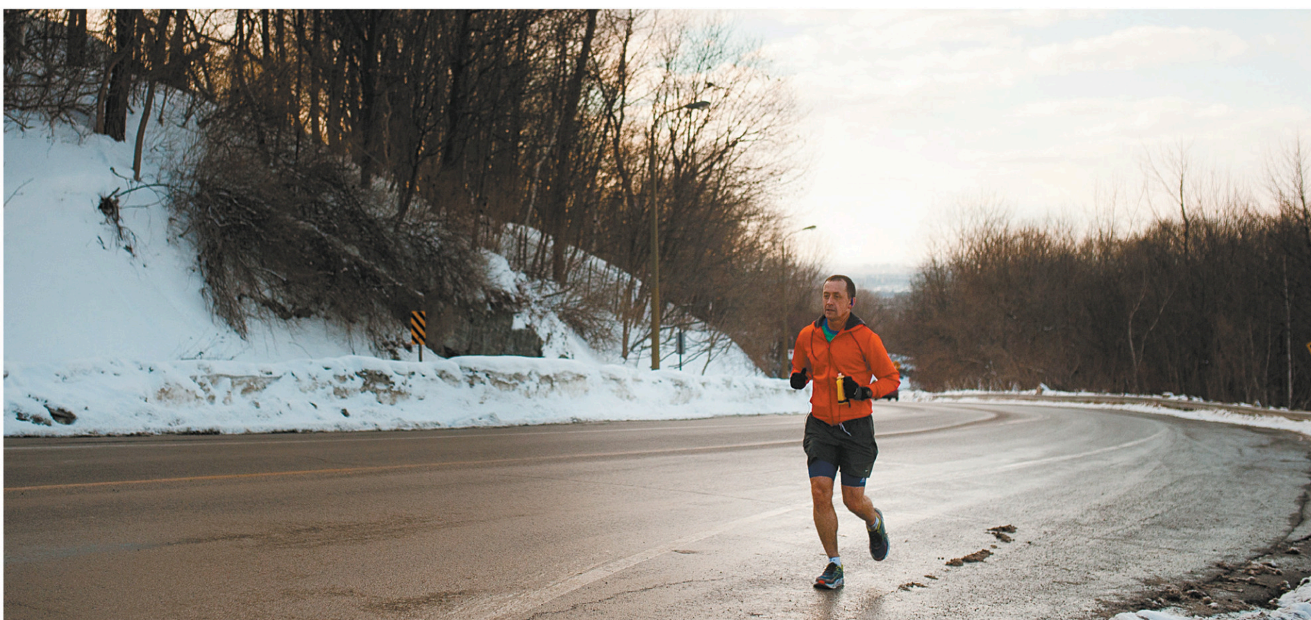
CATHERINE LEGAULT LE DEVOIR

L'administration Plante compte réduire la circulation automobile sur la voie Camillien-Houde pour lui redonner un caractère récréatif.