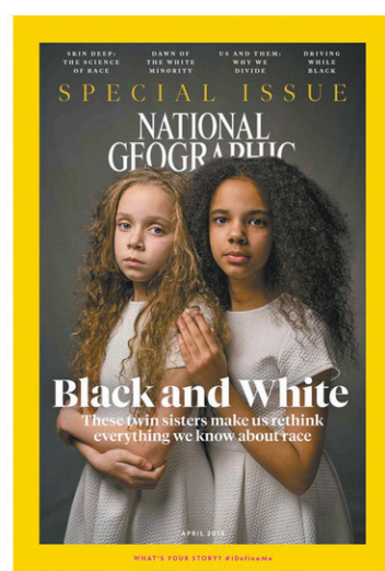
L'édition d'avril du magazine National Geographic

Parallèlement, le magazine décrivait les indigènes d'autres pays comme « des exotiques ou des sauvages, qui étaient souvent nus ». Ces portraits