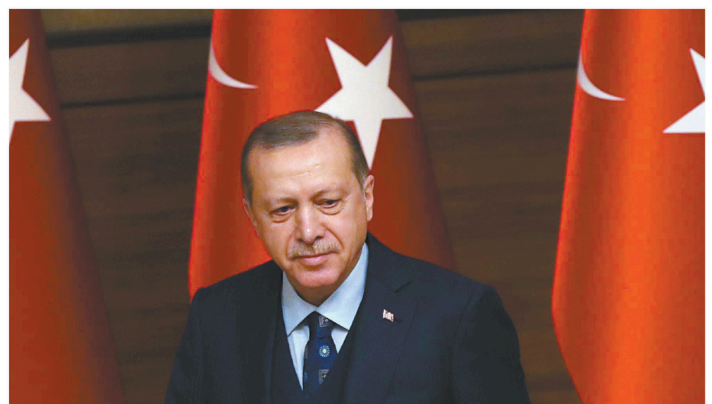
ADEM ALTAN AGENCE FRANCE-PRESSE

Depuis le coup d'État raté de juillet 2016, une répression sans précédent s'est abattue sur la Turquie. Cent soixante-dix mille limogeages dans la fonction publique, quarante mille emprisonnements,