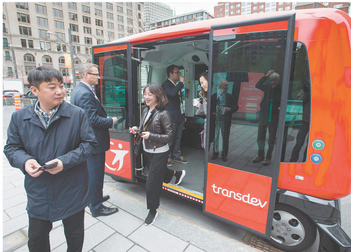
Mise à l'épreuve d'un autobus autonome à Montréal, en 2017

Cette formidable croissance du pôle québécois s'accompagne également d'une réflexion majeure sur les impacts que l'IA aura dans la société. Cette réflexion s'est concrétisée avec la tenue de la Conférence sur le développement responsable de l'intelligence artificielle, en novembre 2017 à Montréal, de laquelle découle la Déclaration de Montréal sur les principes du développement éthique de l'IA. À ces deux initiatives s'ajoute la mise en place, sous l'impulsion du bureau du scientifique en chef