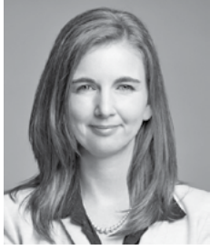
Maude Laberge, mairesse