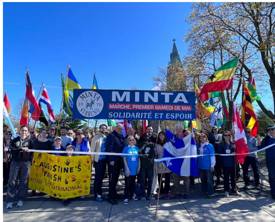
Il s'agissait d'une 45e marche Minta.