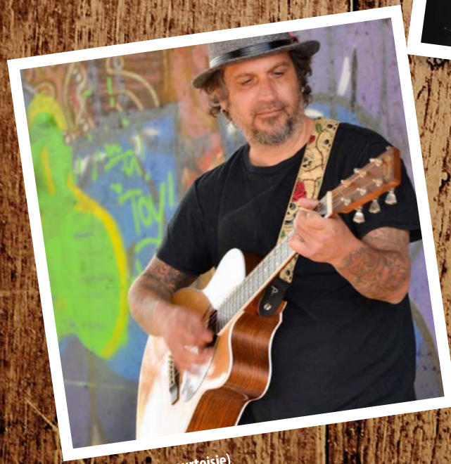
Country