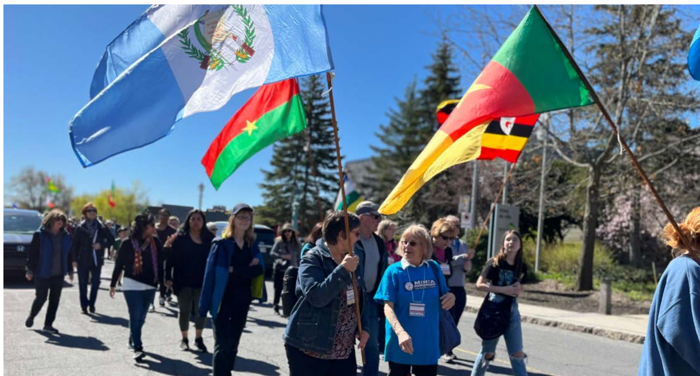
La marche se déroule sur plus de 5 km dans les rues de Saint-Bruno.

Le maire a soulevé le fait que Minta est reconnu non seulement à l'international, mais aussi localement.