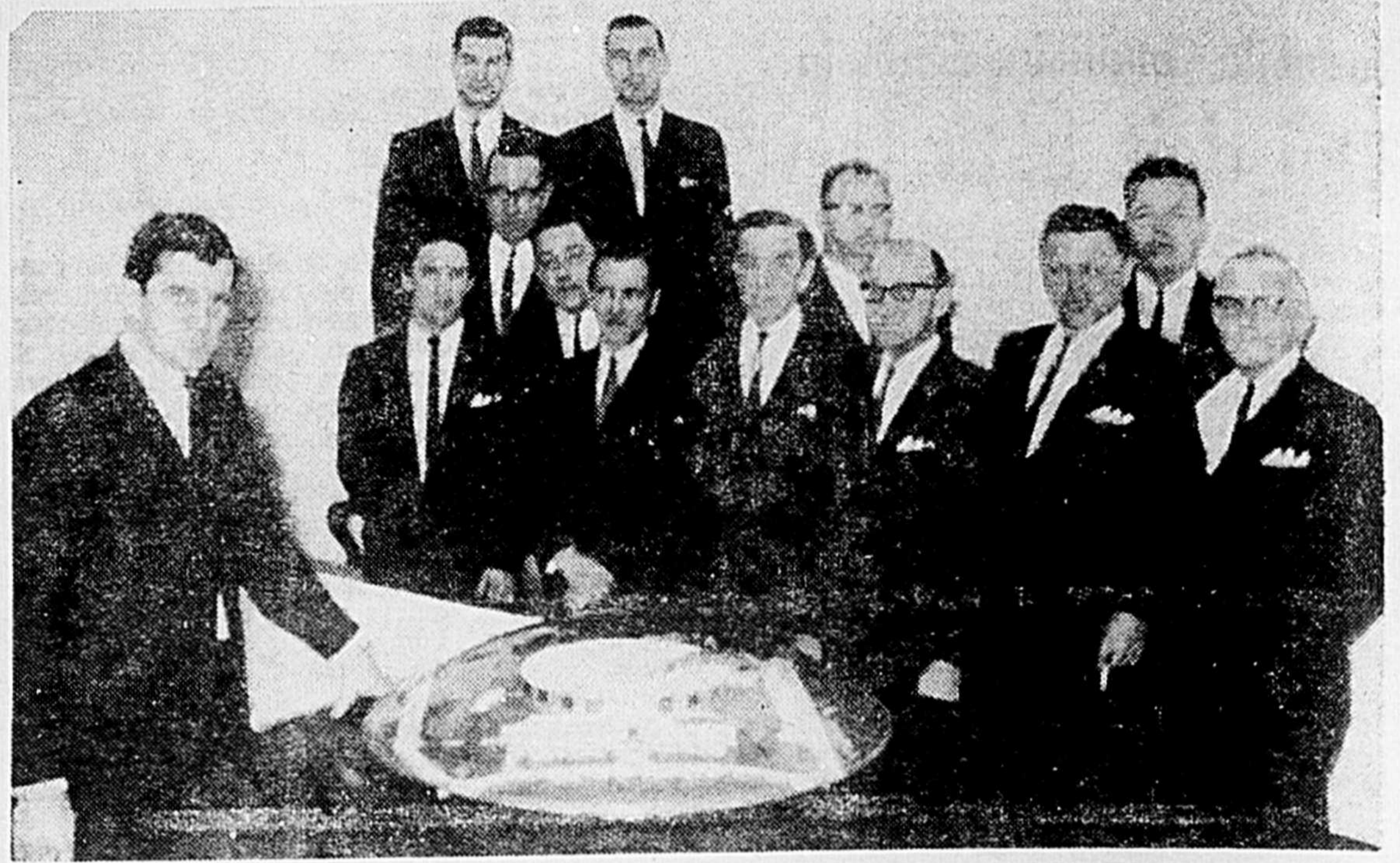
CA BOUGE AU CENTRE D'APPRENTISSAGE DE JOLIETTE

Celui qui prend garde à l'instruction prend le chemin de la vie; mais celui qui néglige la réprimande s'égarera. (Prov 10, 17) (Texte choisi par la Société Catholique de la Bible).