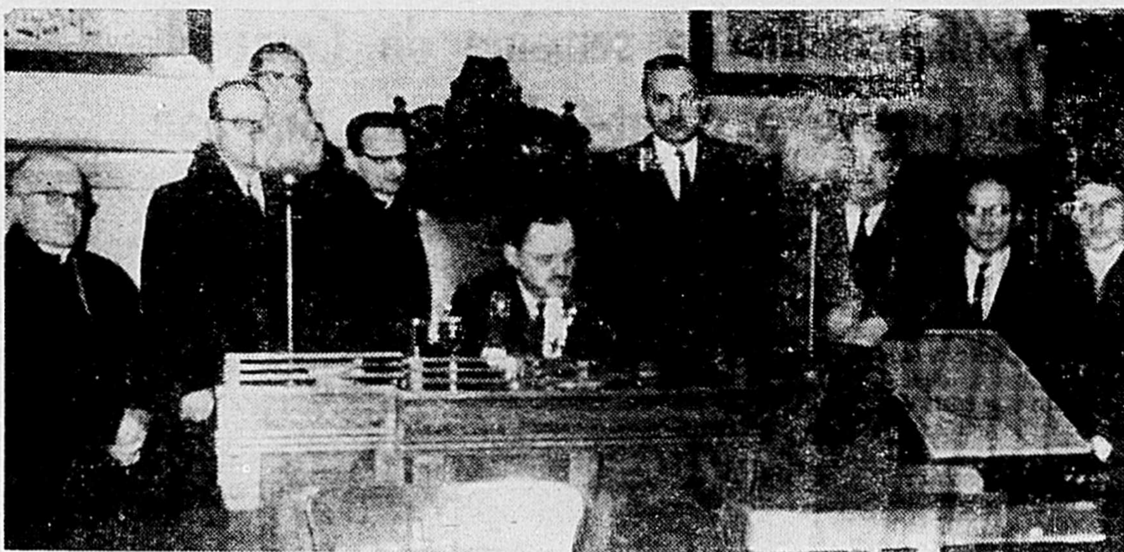
Son Honneur le Maire C.-A. Roussin proclamant la Semaine scout à la séance régulière du conseil municipal, lundi soir.