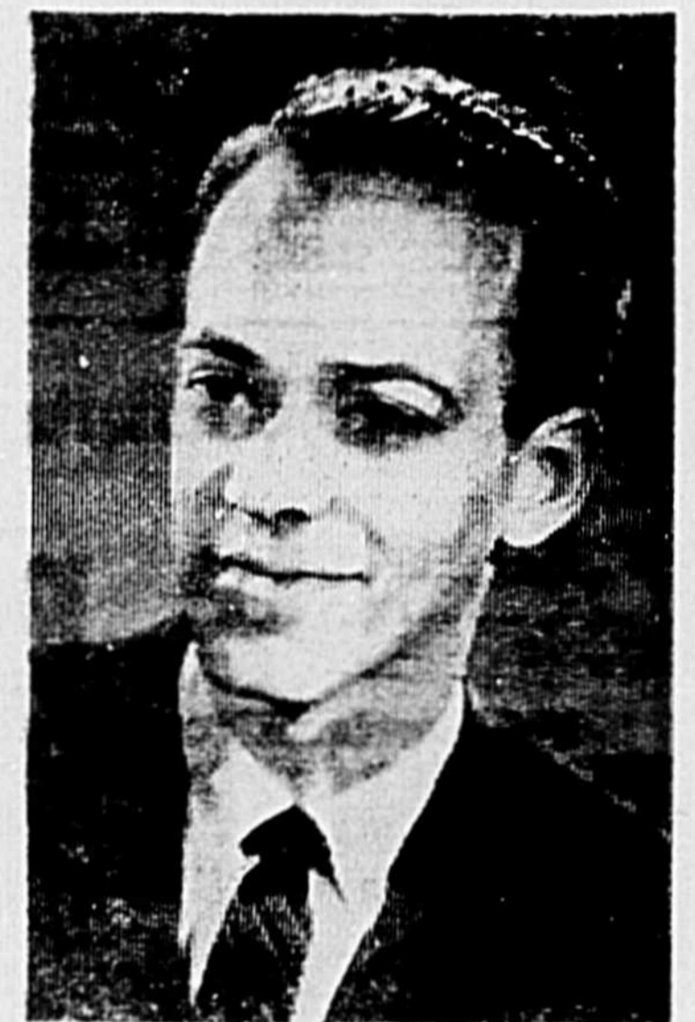
A LA SSJB

Lors de l'assemblée du Conseil Général de la SSJB du diocèse de Joliette, le 28 février prochain, on étudiera la question des fonds mutuels.