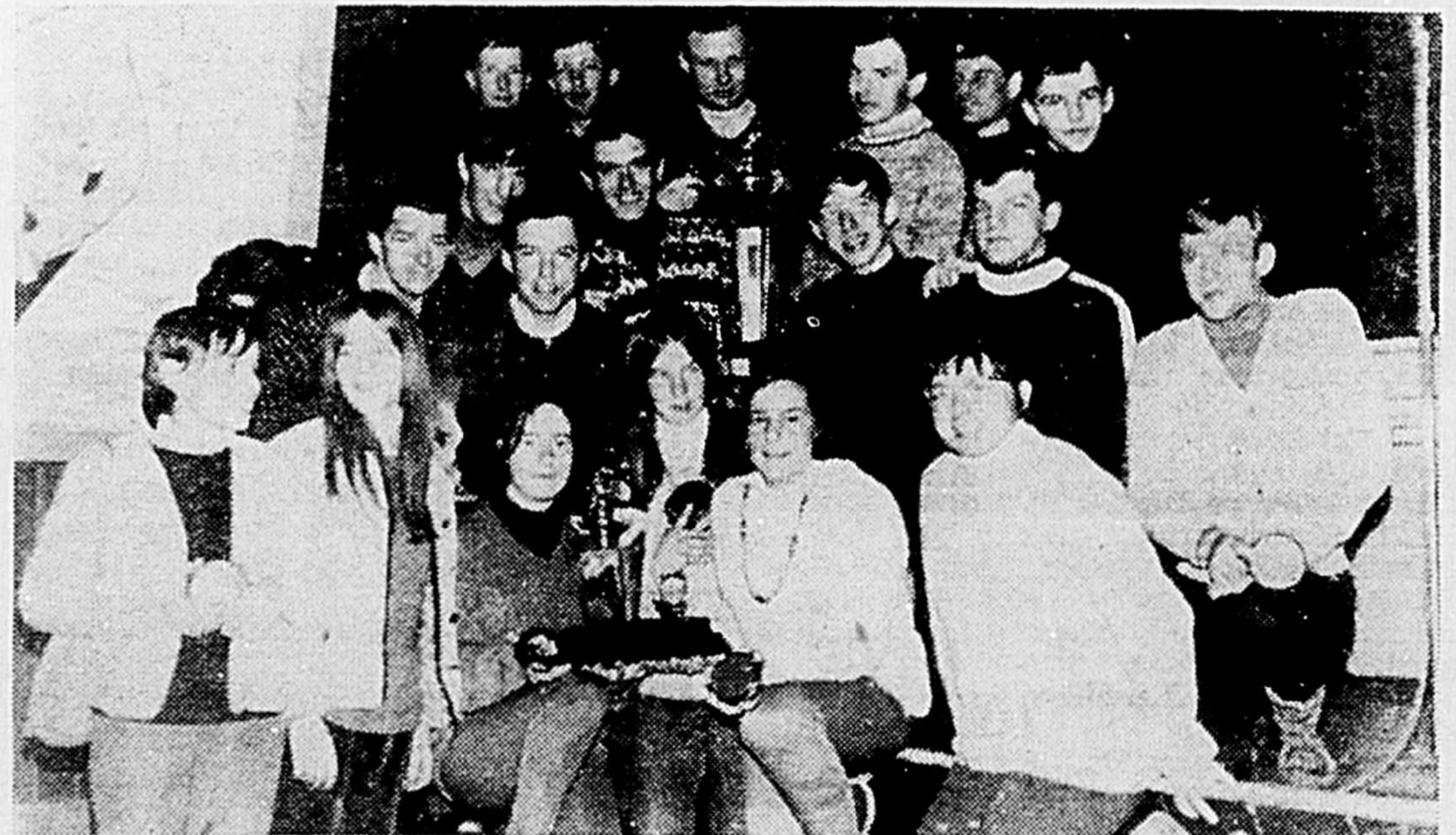
Les équipes féminine et masculine de ski du Séminaire de Joliette qui ont balayé, en fin de semaine dernière, les championnats intercollégiaux. Une "serpent" d'équipe.

INVITATION A TOUS LES ETUDIANTS ET ETUDIANTES