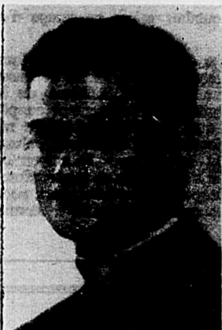
NOUVEAU CURE DE LAVALTRIE

Mgr Jetté annonçait ces jours-ci les nominations ecclésiastiques suivantes qui prendront effet le 1er mars.