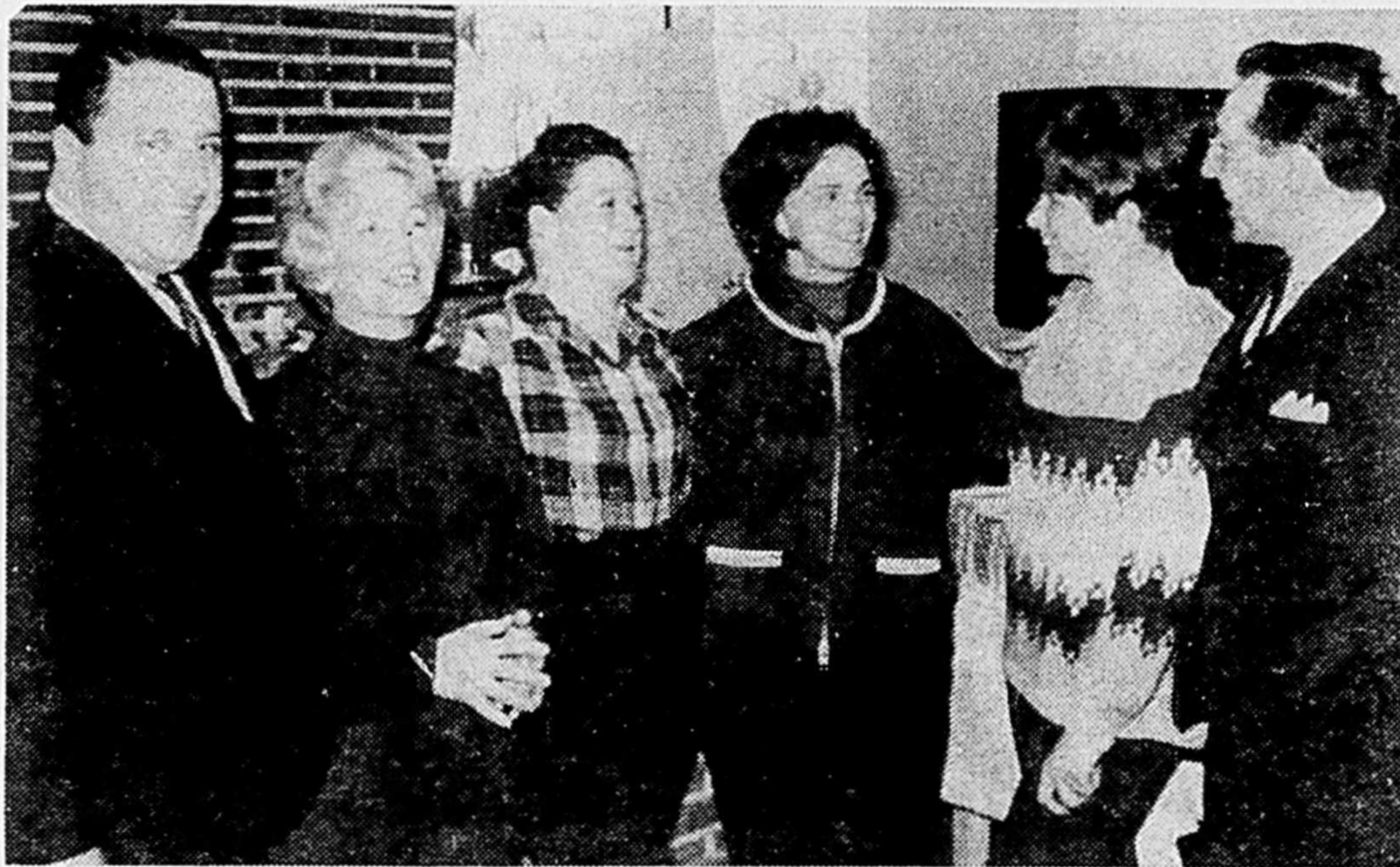
BONSPIEL FEMININ A LA RONDE

L'emplacement de l'Expo a trois milles et demi de long.