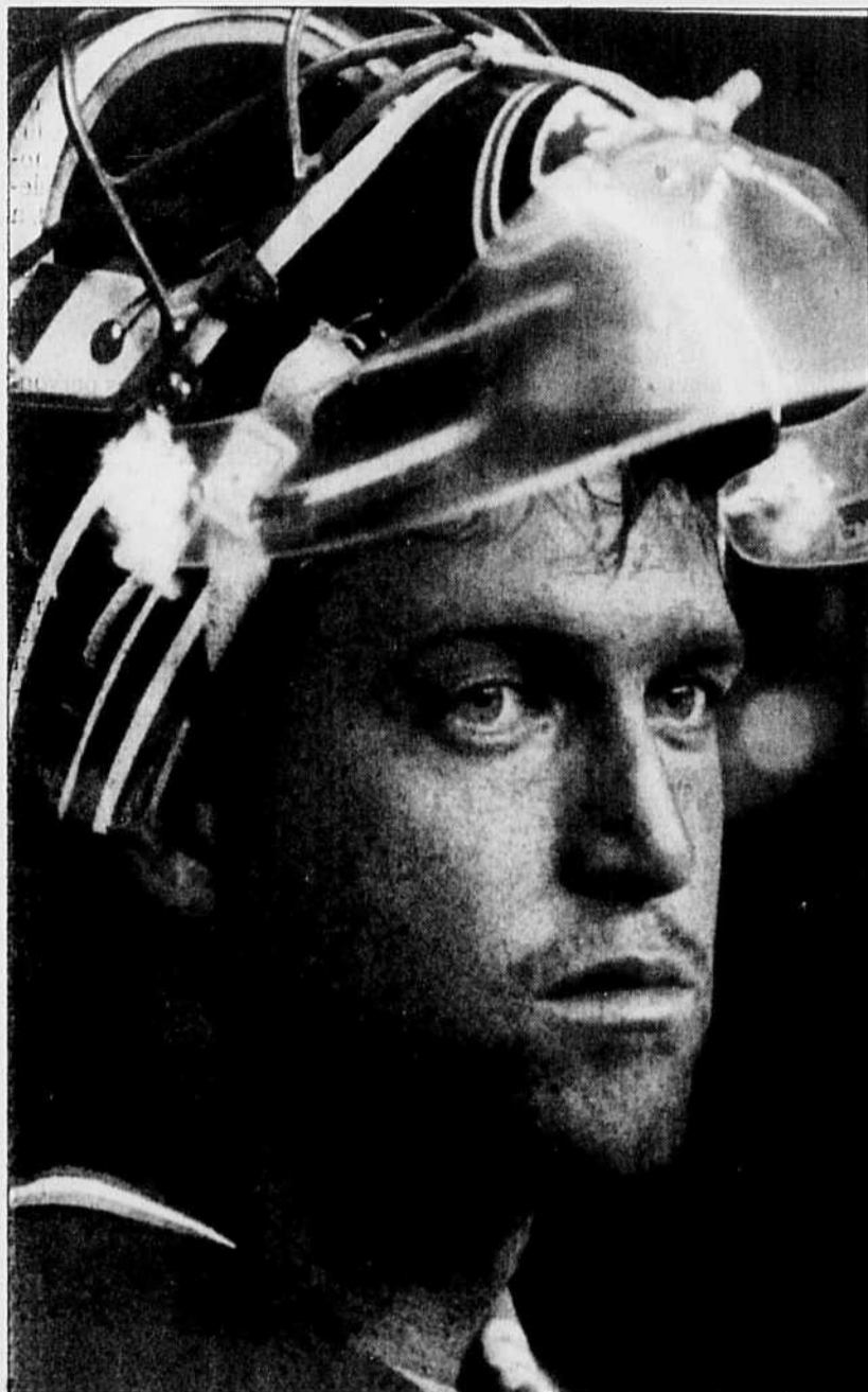
Gros contrat ou pas, Patrick Roy continue de jouer le rôle de leader chez le Canadien. Au cours de la dernière semaine, Roy a repoussé 96% des rondelles décochées en sa direction.