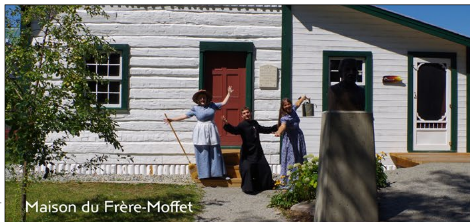
Maison du Frère-Moffet

L'apprentissage se faisant à raison d'une moyenne de 23 heures par semaine, il sera possible pour les étudiant.e.s de poursuivre leur cheminement professionnel à temps partiel et certains employeurs associés au programme permettront une libération du travail pour la durée de la formation. Les inscriptions sont déjà en cours et l'AEC sera lancée à la mi-août.