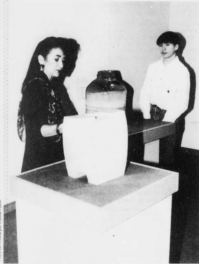
Après l'objet utilitaire, une période à l'intérieur de laquelle nos visiteurs se sont attardés à la pureté des formes, à la recherche des textures.

Cette rétrospective, une grande initiative du Musée des beaux-arts, qui de surcroît, s'est donné la peine de la perpétuer dans un catalogue, risque d'inscrire définitivement Doucet-Saito, si ça n'est déjà fait, au rang des artistes majeurs au pays.