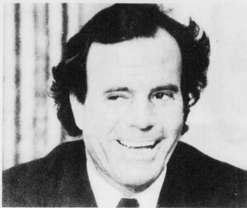
De passage à Montréal hier pour mousser son dernier disque, «Starry Night», Julio Iglesias, calme et amusé, avec un certain flegme, s'est prêté pendant une quarantaine de minutes au jeu de la conférence de presse.

Etes-vous pour le recours au condom? «Je n'ai pas beaucoup d'énergie. Celle que j'ai, je la garde pour mon métier.» Donc vous êtes pour, insiste le reporter. Et Julio, sous les