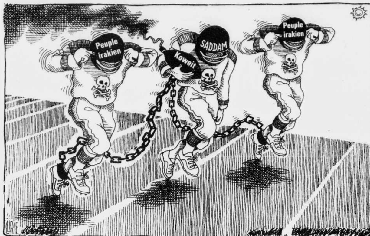
Un travail d'équipe