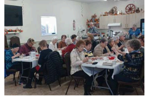
9 avril : Dîner pour personnes seules, 23 personnes