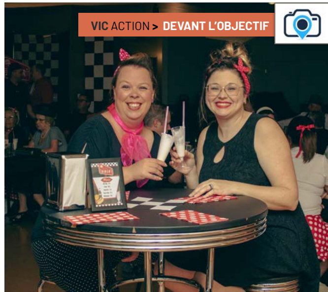
10 mai: Soirée sors de chez vous et voyage... dans le temps (1950)