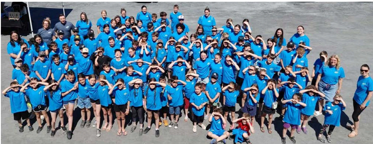
2 juin: Une partie de nos jeunes entrepreneurs et de nos bénévoles lors de la Grande Journée des Petits Entrepreneurs.