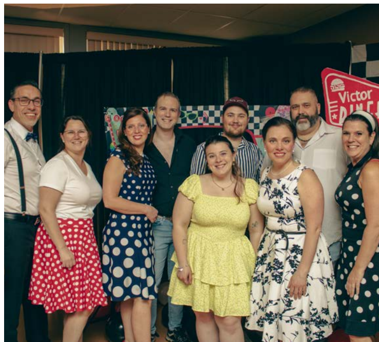
10 mai: Soirée sors de chez vous et voyage... dans le temps (1950)