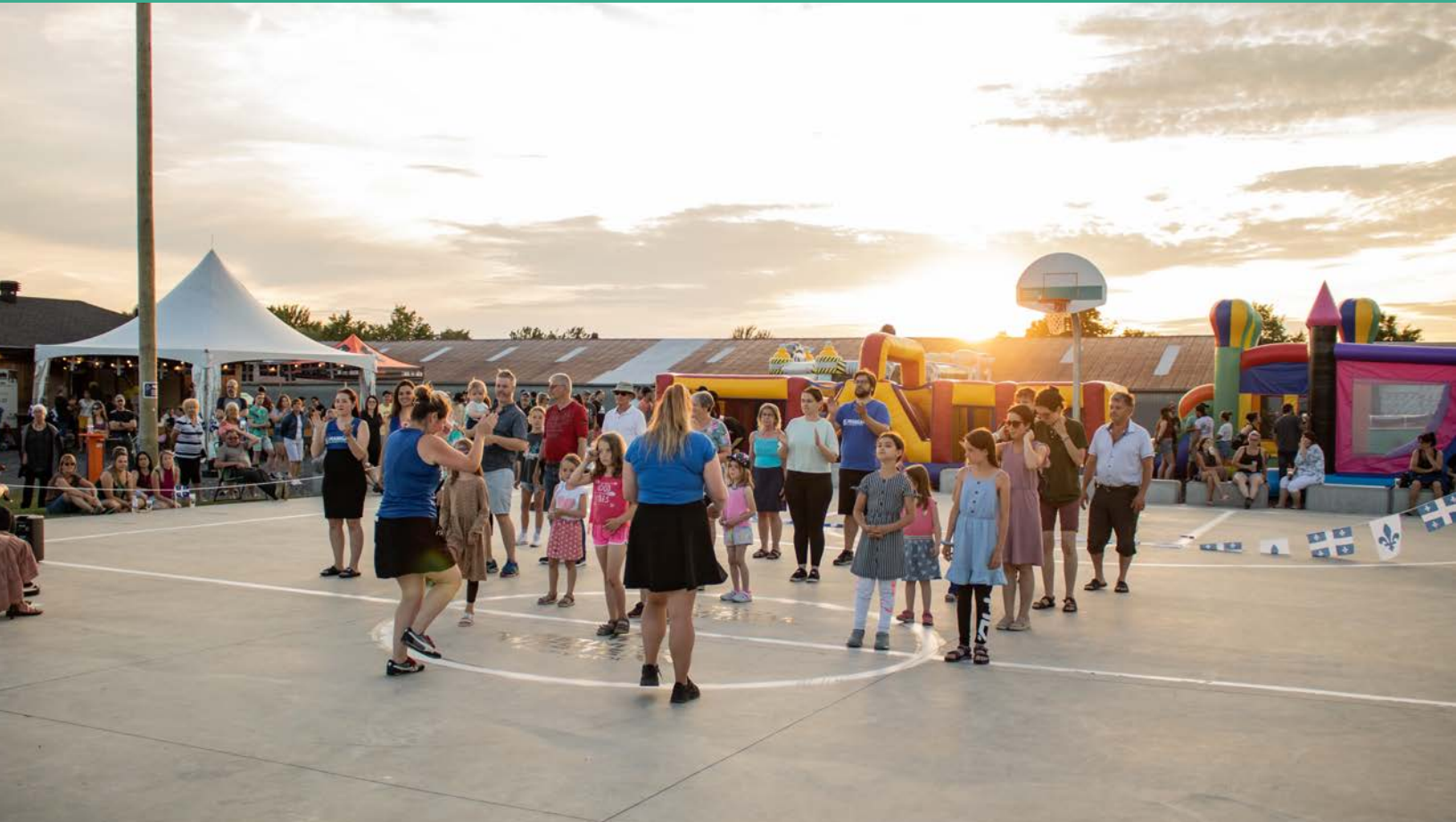
Fête nationale 2023 | Juin 2023