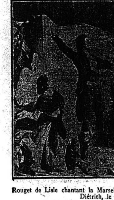
Rouget de Lisle chantant la Marseillaise devant le Maire de Strasbourg, Diétrich, le 25 avril, 1792.