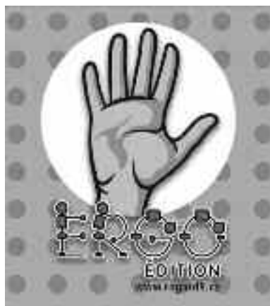
La langue des signes : Pour développer la motricité fine

La maison d'édition Ergo Édition, devenu Regard9 a mis en vente dernièrement un jeu de cartes « La langue des signes » pour développer la motricité fine, développé en collaboration avec l'Institut Raymond-Dewar. Ce jeu de 68 cartes permet d'apprendre à écrire des mots avec l'alphabet de la langue des signes québécoise développant ainsi la motricité fine de manière ludique en faisant bouger les doigts des enfants. Regard9 favorise le développement moteur et social des enfants par le biais de livres, de jeux, d'animations et des outils gratuits.