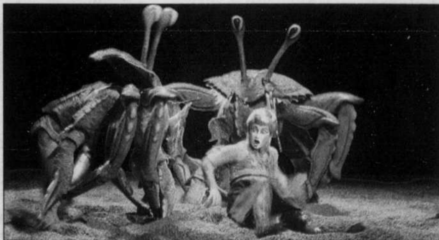
Une scène de KA, une création monumentale du Cirque du Soleil lancée demain soir à Las Vegas.