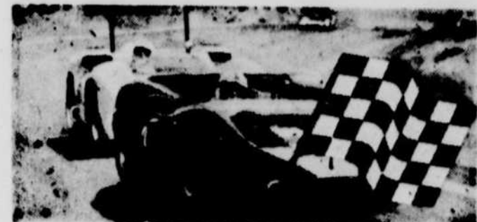
U.S.A.C. ETABLIT LES SPECIFICATIONS DE LA COURSE EN CIRCUIT ROUTIER

LES DEUX FRÈRES P 13 — aides, puis à purée une punition. MINNEAPOLIS (PA) — Mickey Redmond a récolté deux