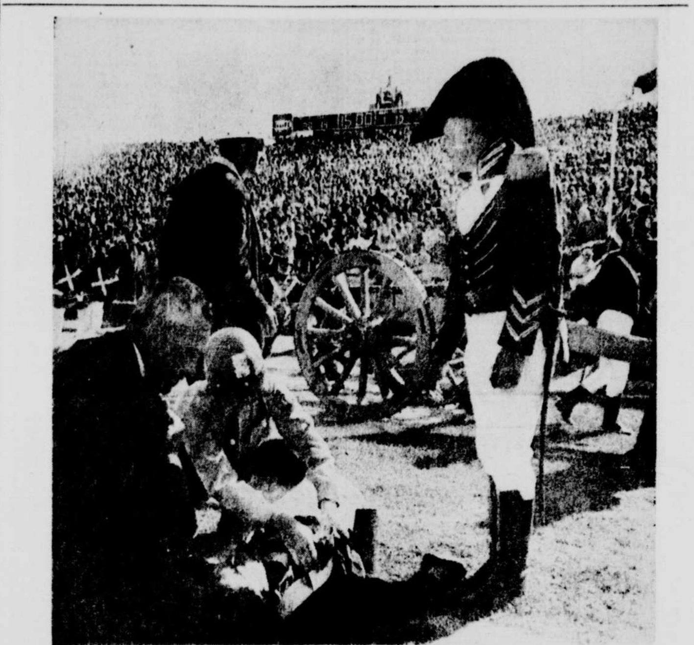
● Un spectacle de mi-temps lors d'une joute de football à la Nouvelle-Orléans a presque eu des suites funestes. Un vieux canon utilisé pendant la reconstitution d'une scène historique a explosé prématurément. Deux figurants ont été blessés et conduits à l'hôpital souffrant de brûlures.

M. Juneau a expliqué: "Ce n'est qu'à une simple fin historique. N'importe qui peut obtenir des journaux publiés depuis 25 ans, mais il est plus difficile d'obtenir des enregistrements d'émissions de radio ou de télévision".