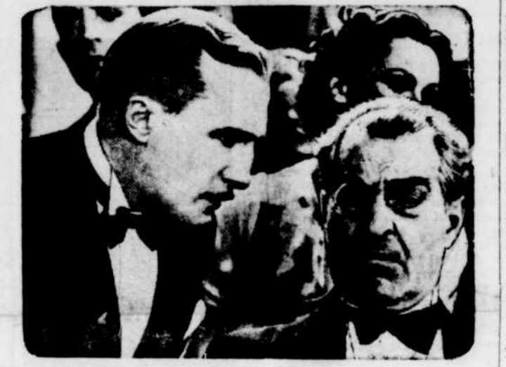
L'amusante pièce de Louis Verneuil a été portée à l'écran, voici Max Dearly et Victor Boucher dans une scène de ce film à l'affiche au Cinéma de Paris, en programme double avec Victor Francen dans "LA VIERGE FOLLE".