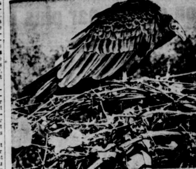
Sans invitation, et particulièrement malvenu, ce vautour américain a quitté son habitat coutumier et pris la direction du nord...