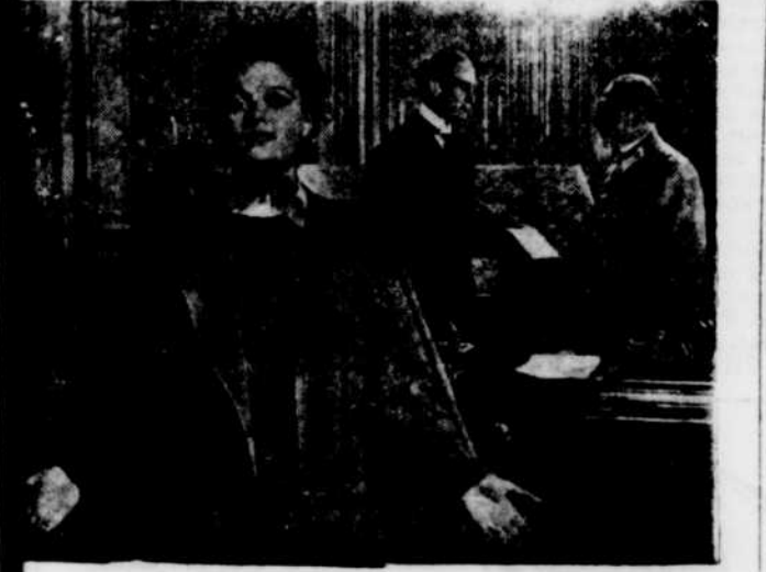
Edith Cavell, dans le rôle-titre de "NURSE EDITH CAVELL" qui tiendra l'affiche du Capitol, dimanche, lundi, mardi de la semaine prochaine. A l'arrière-plan H. B. Warner, dans le rôle de l'attaché américain à Bruxelles, plaidant avec F. Reichert, (dans le rôle du baron von Bising), pour empêcher la peine de mort à laquelle était condamnée la martyre de la grande guerre. En programme double avec "FIVE TIMES FIVE" avec les jumeaux Dionne.