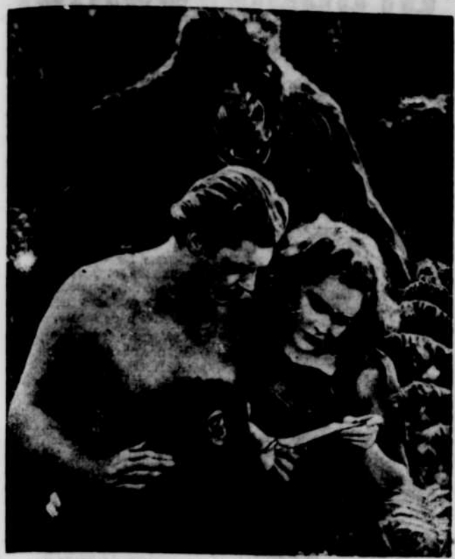
Johnny Weismuller et Maureen O'Sullivan dans une scène de "TARZAN FINDS A SON" qui tiendra l'affiche du Rialto dimanche, lundi, mardi, mercredi en programme double avec "HEAVEN WITH A BARBED WIRE FENCE" mettant en vedette: Jean Rogers.