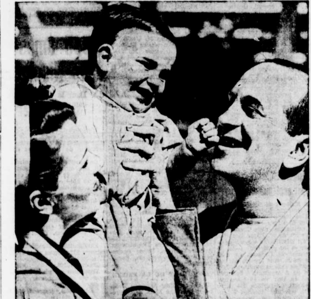
Une famille heureuse: le comédien Al Jolson, chanteur populaire favori de la scène et de l'écran, Ruby Keeler, vedette de cinéma née à Halifax et leur fils, voit son bonheur menacé. Au cours du plaidoyer pour divorce de sa femme, Jolson, le cœur brisé, a déclaré que leurs différends provenaient de troubles de famille et n'étaient pas assez importants pour motiver le divorce.