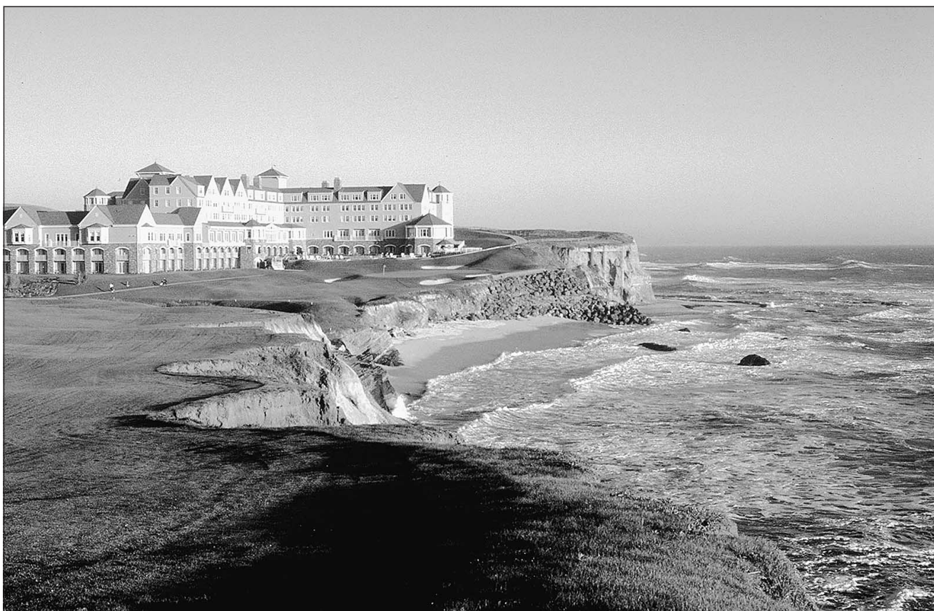
Avec son terrain de golf donnant sur l'océan Pacifique, le Ritz-Carlton Half-Moon Bay Resort, situé à 45 minutes de San Francisco, a tout pour plaire aux voyageurs bien nantis.

> le Golden Princess (Princess Cruises), au départ de Fort Lauderdale les 26 octobre et 16 novembre, pour une semaine, avec escales à Princess Cay, Grand Cayman, St-Martin et St. Thomas : 706 $ plus 285 $ de taxes portuaires pour une semaine en cabine intérieure de Catégorie K, avion de Montréal non inclus (prix régulier : 1842 $ plus taxes).