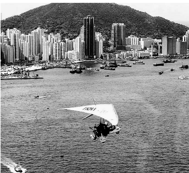
Hong-Kong est probablement la ville la plus touchée dans le monde par le SRAS, avec une baisse de 36 % du nombre de liaisons avec l'Europe et de 69 % avec les États-Unis et le Canada.

Dans les très grandes agences commerciales, on se dit incapable d'envisager la disparition d'Air Canada. Plus que le domaine du voyage, ce serait toute l'économie du pays qui se trouverait déstabilisée.