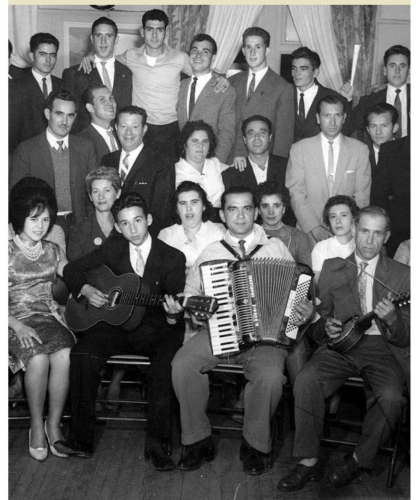
Quelques membres de la communauté portugaise de Montréal circa 1960.

L'immense majorité de ces Luso-Canadiens (de Lusitanie, la province romaine autrefois identifiée au Portugal) provient de la grande vague d'immigration des années 50 et 60. La présence des Portugais au Canada remonte toutefois aux tous premiers jours de la colonie. Le plus célèbre des colons a été Pedro Da Silva, le premier facteur officiel du Canada qui a oeuvré au tournant du XVII e siècle entre Montréal et Québec. Joao Rodrigues, par exemple, qui mort à Beauport en 1720, serait l'ancêtre de la plupart des Rodrigue actuel. Et c'est en 1768 que les premiers Juifs portugais, arrivés à Montréal huit ans plus tôt, ont construit la première synagogue au pays.