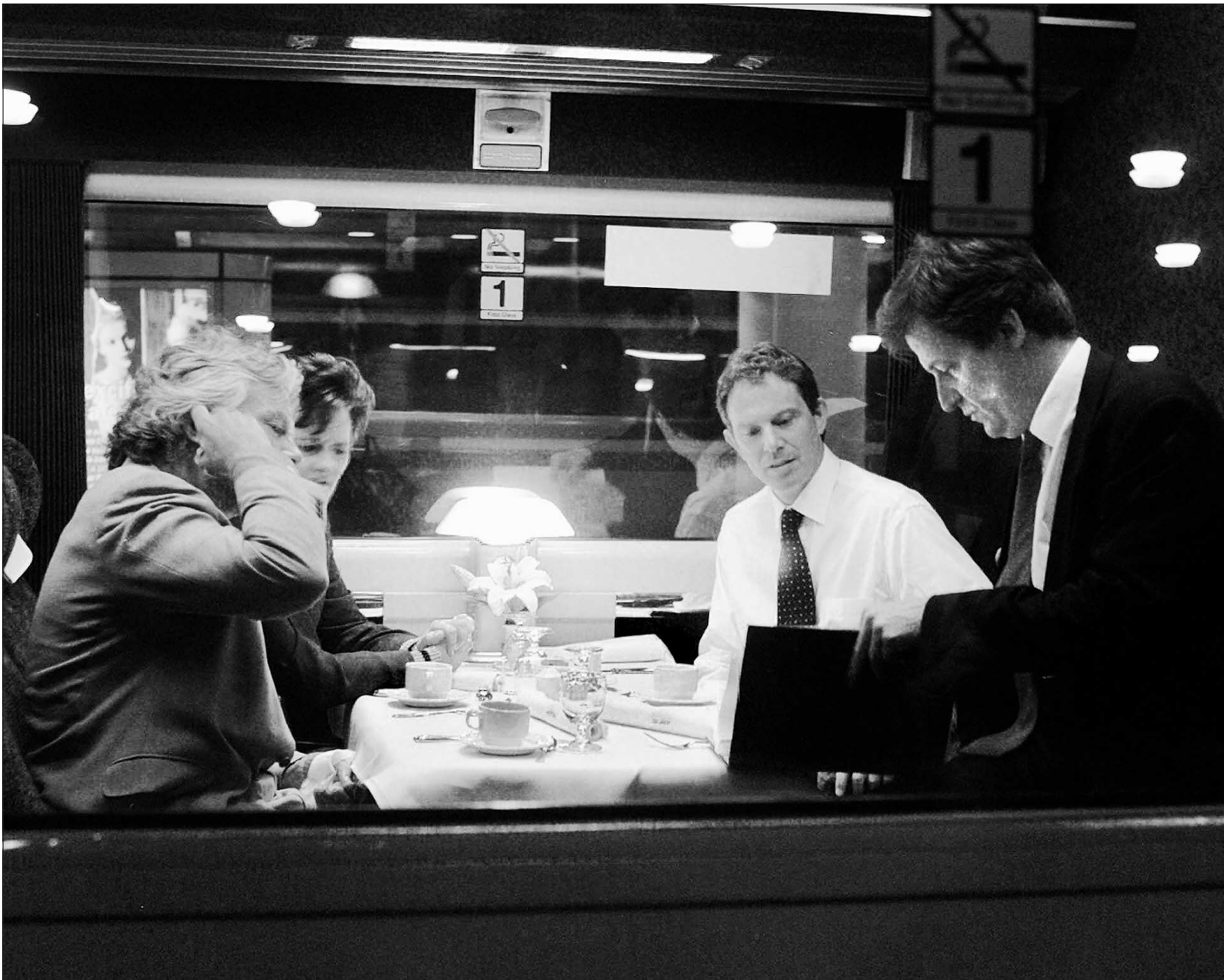
Une guerre ouverte fait rage depuis une semaine en Angleterre entre le tout-puissant chef des communications de Downing Street, Alastair Campbell et la BBC au sujet de la couverture de la guerre en Irak. M. Campbell est très proche du premier ministre Tony Blair, avec qui il discute dans cette photo prise en 1997, tout juste avant le déclenchement des élections où M. Blair a pris le pouvoir. De l'autre côté de la table sont assis Cherie Blair et le milliardaire Richard Branson, grand patron de Virgin.