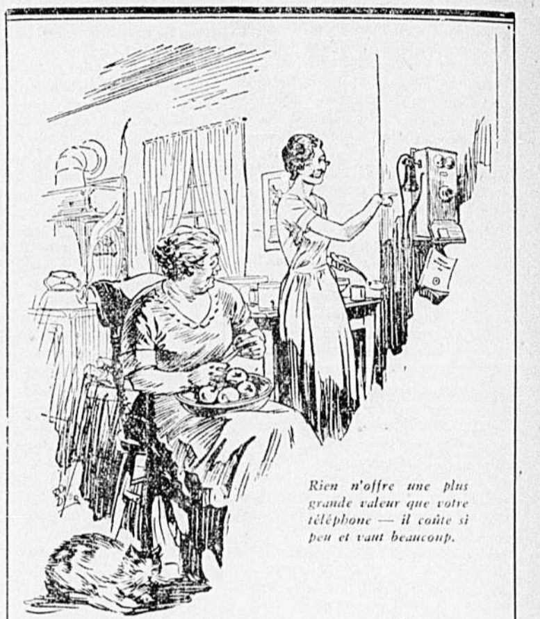
Rien n'offre une plus grande valeur que votre téléphone — il coûte si peu et vaut beaucoup.

— Pourquoi es-tu si triste ? — Ma femme a passé trois mois à la campagne. — Eh bien. — Je lui ai dit que j'avais passé toutes mes soirées à la maison... je viens de recevoir le compte d'électricité. J'en ai pour 75 sous.