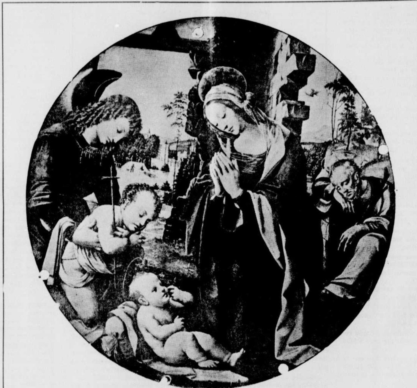
LA VIERGE EN ADORATION DEVANT SON DIVIN FILS