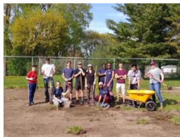
L'équipe de Ville en vert, la CIEC et plusieurs bénévoles qui aménagent le potager Fourche et Fourchette