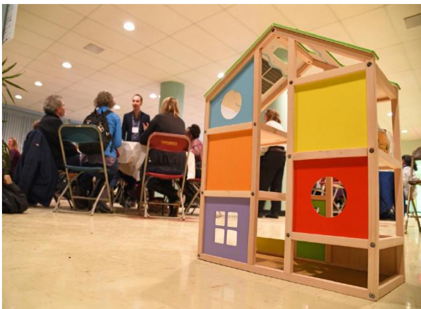
Photographie symbolique de la « future Maison de quartier »

4 parutions concernant la future Maison de quartier dans la presse locale