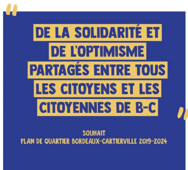
Campagne de souhaits réalisée lors de la démarche de planification stratégique en développement social