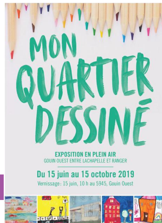
Affiche « Mon quartier dessiné » réalisée par l'AGAGO

3 parutions concernant la revitalisation de Gouin Ouest dans la presse locale