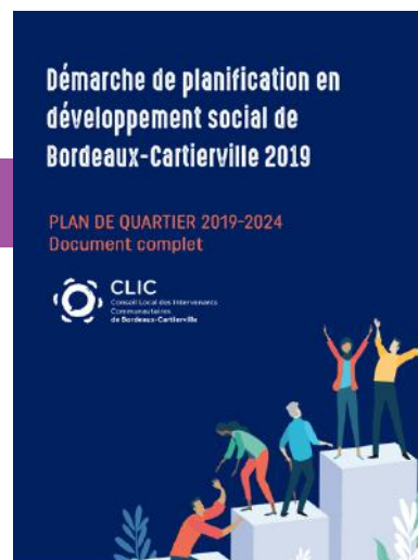
Le document final de la démarche