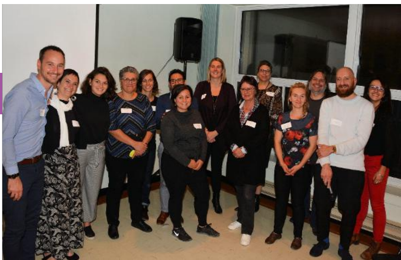
Le comité coordinateur de la démarche le 16 octobre 2019

Ce grand rendez-vous aura été l'occasion de présenter les 23 actions (liées à 4 grands changements) du plan de quartier et les stratégies transversales à nos partenaires, puis de répondre à leurs questions. S'en est suivi un exercice d'appropriation du plan, lors duquel les participant.e.s étaient invité.e.s à identifier les liens possibles entre les différent.e.s actions et changements. Une fois le plan de quartier validé, nous avons eu le plaisir de partager un moment autour d'un verre pour célébrer cette belle année de travail!