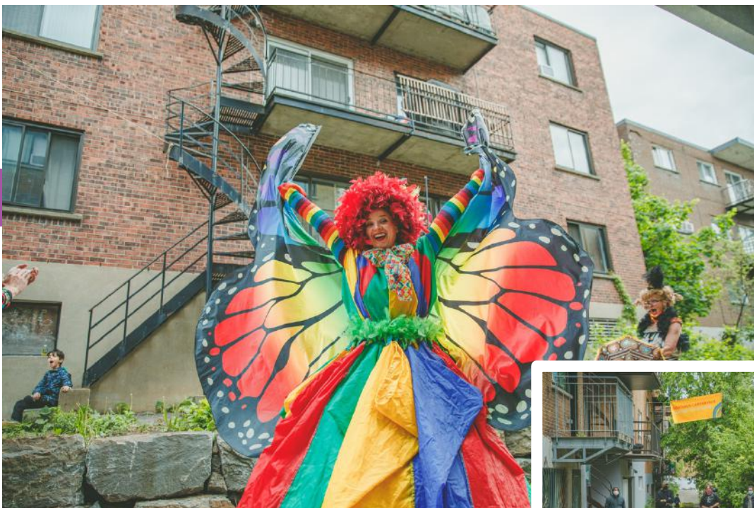
La troupe Drôladon et les partenaires du CLIC pour les balconnés à Cartierville le 31 mai 2020.

Un grand merci et bravo à toutes ces personnes, elles ont fait la différence !