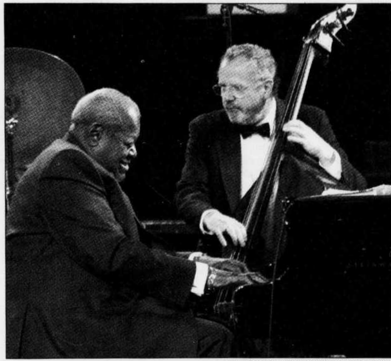
Oscar Peterson et Niels Henning Orsted Pedersen (décédé en 2005) au cours d'un concert donné à Berne, en Suisse, au printemps 2000.

À peine associé à Granz, Peterson devint le pivot rythmique du Jazz At The Philharmonic (JATP) . Comme ce nom l'indique, il s'agissait de présenter des musiciens dans des salles aussi grandes qu'ornementées. Au cours de cette aventure, qui fut d'ailleurs longue,