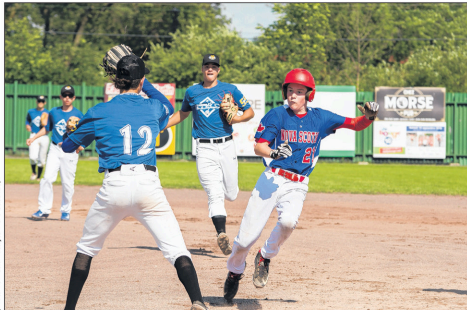
Les équipes des Bleus et de la Nouvelle-Écosse ont croisé le fer samedi après-midi.