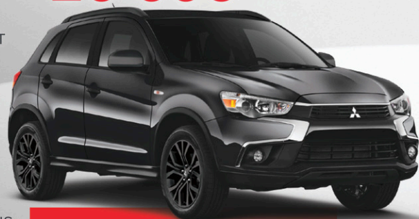
modèle RVR BLACK EDITION illustré

RVR ES MANUELLE 2017 EN LOCATION À SEULEMENT 60 $ PAR SEMAINE.