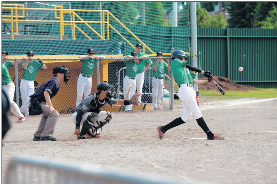
Les Gris et les Verts se sont affrontés en demi-finale.