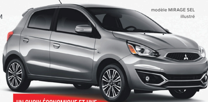
modèle MIRAGE SEL illustré

UN CHOIX ÉCONOMIQUE ET UNE GARANTIE IMBATTABLE Consommation de 6 litres au 100 km avec la version CVT