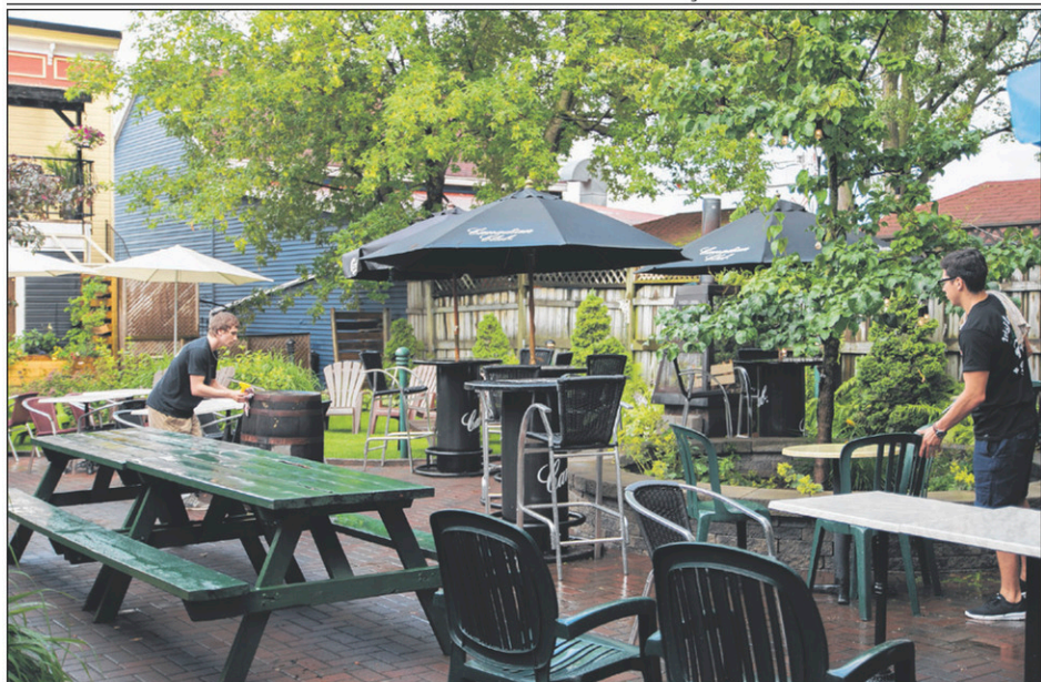
Vendredi soir, les employés du Glen Morgan Irish Pub tentaient de sécher les tables vers 17h30. À l'image de l'été, il y a eu une bonne averse avant le souper.