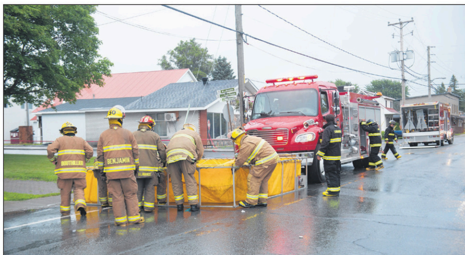
Les pompiers ont limité les dommages lors de l'incendie survenu à l'entreprise Saucisson d'Antan, le 13 juillet dernier.

bornes-fontaines, les sapeurs ont fait appel à plusieurs casernes pour l'obtention de citernes. Une trentaine de pompiers de Farnham, Saint-Jean-sur-Richelieu, Sainte-Angèle-de-Monnoir, Saint-Alexandre et Marieville se sont rendus sur les lieux.