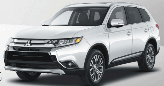
modèle OUTLANDER GT 2017 illustré