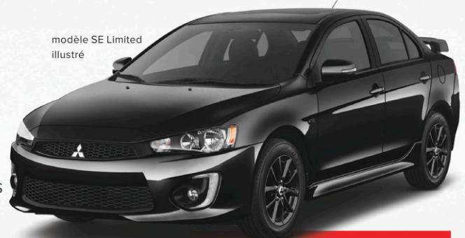
modèle SE Limited illustré

LANCER ES MANUELLE EN LOCATION À 50 $ PAR SEMAINE.