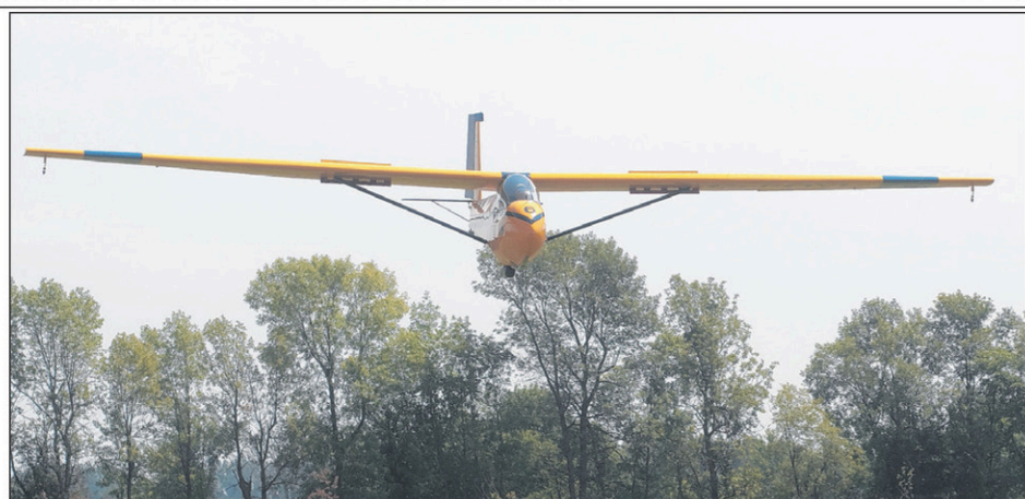
Le mauvais temps a causé du retard dans la formation des cadets, de sorte que l'horaire des vols doit être prolongé.

Tu es une jeune maman qui a envie de rencontrer d'autres mères? Jeunes mères en action est la ressource pour toi. Situé au 330, rue Laurier, l'organisme offre différents services pour les mères et leurs enfants. Une halte-garderie est offerte gratuitement lors des activités. Information: Stéphanie ou Malorie, 450 348-4330.