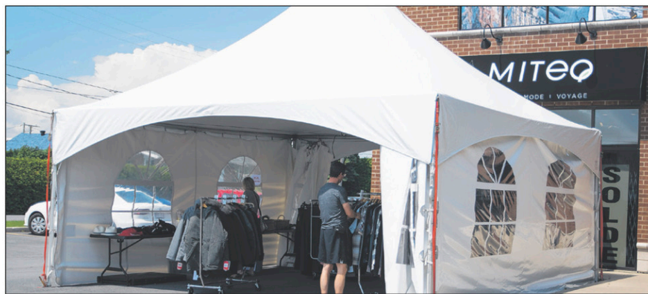
La boutique Miteq fermera ses portes sous peu. Tous les articles sont en vente au rabais.

«L'été arrive plus tard. Il fait chaud à la mi-juillet, alors que c'est le temps des ventes. L'hiver est plus doux. Cela retarde l'achat des