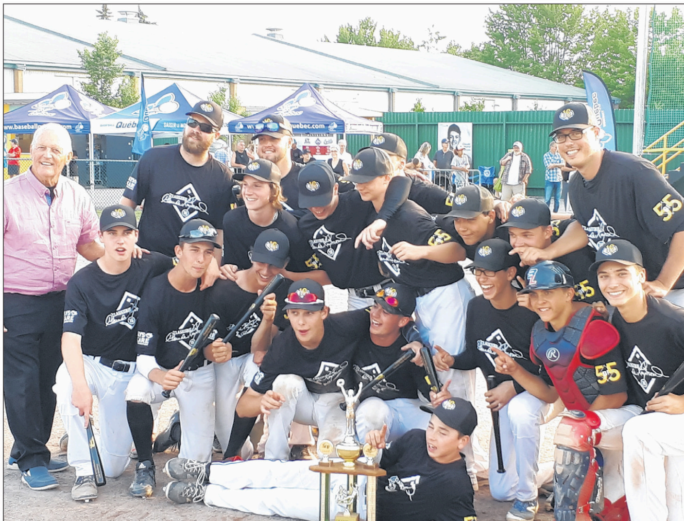
L'équipe Noire, championne de l'édition 2017 de la Classique Claude-Raymond.

prendre des notes en vue de la sélection des joueurs qui formeront l'équipe du Québec au prochain Championnat canadien.