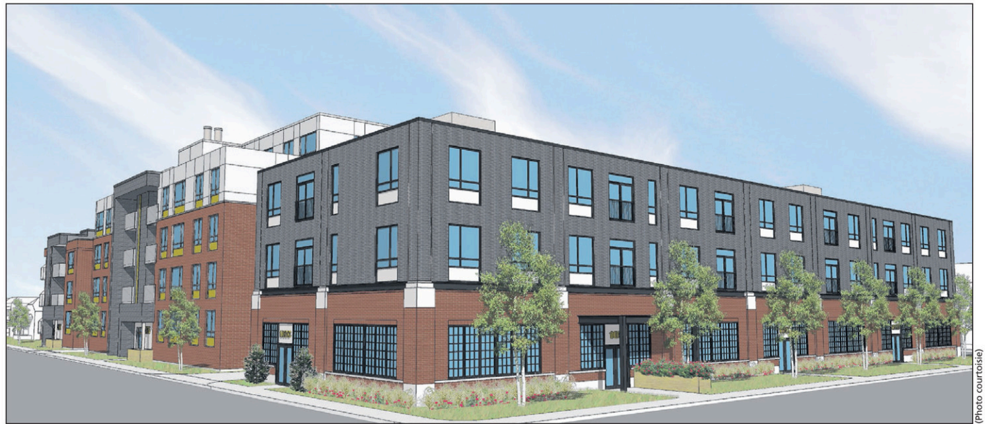
Une première phase du projet de l'ancienne usine Grenier est déjà en marche.