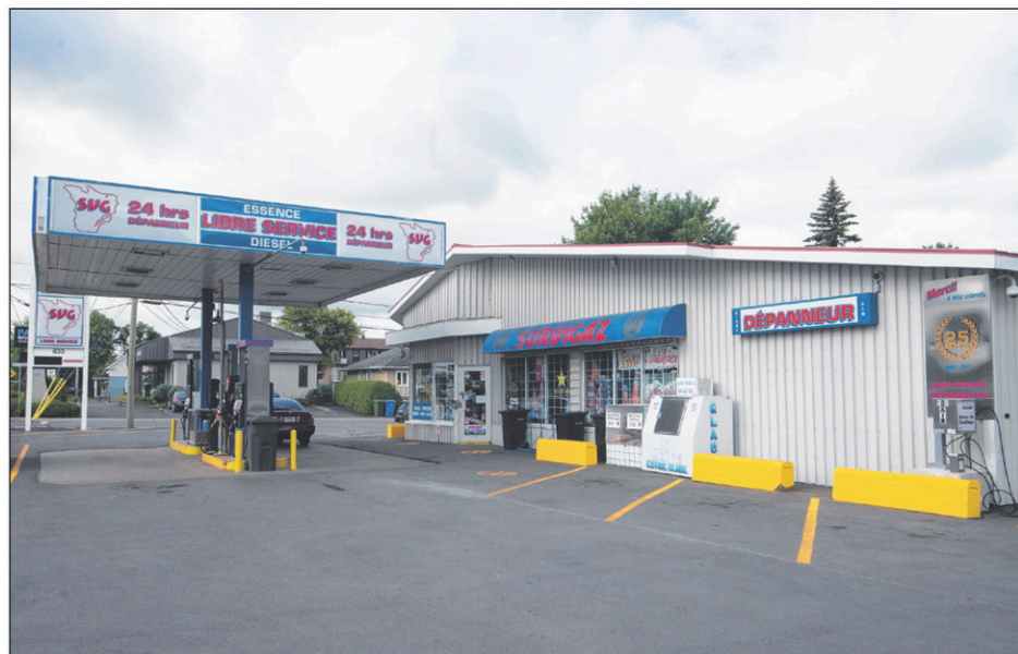
Les employés de la station-service Survigaz d'Iberville ont été victimes de trois vols qualifiés commis en mai et juin.

La nuit du 30 juin, la police avait intercepté une auto et arrêté les deux autres hommes accusés pour tous ces vols. Selon les représentations de M e Clémence Giroux, de la Couronne, deux armes à air comprimé avaient alors été saisies. Les suspects portaient plus d'une épaisseur de vêtements, ce qui permettait de croire qu'un autre vol se préparait.