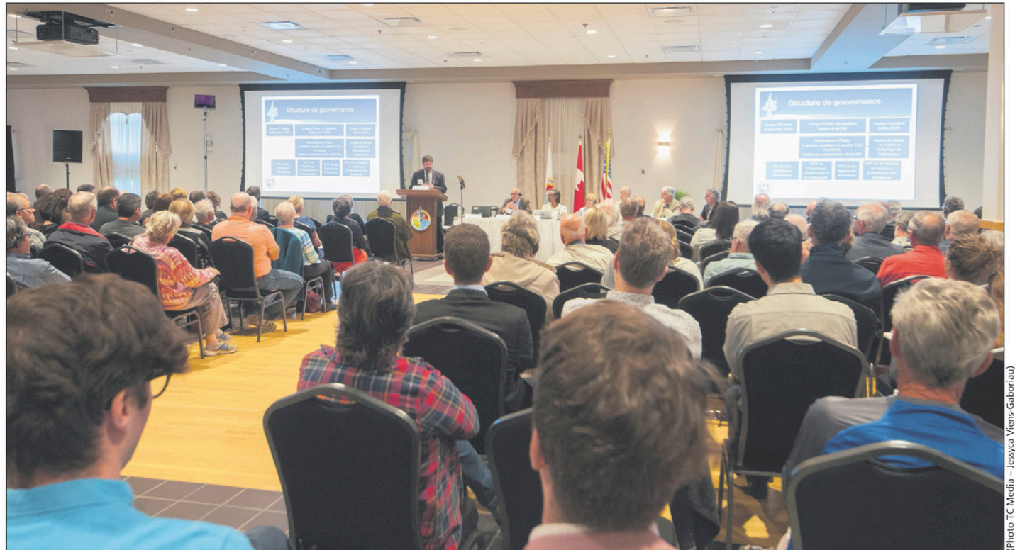
Environ 125 personnes ont assisté à la rencontre d'information de la Commission mixte internationale.

Depuis de nombreuses années, des citoyens demandent d'utiliser le canal comme évacuateur de crue. Cette