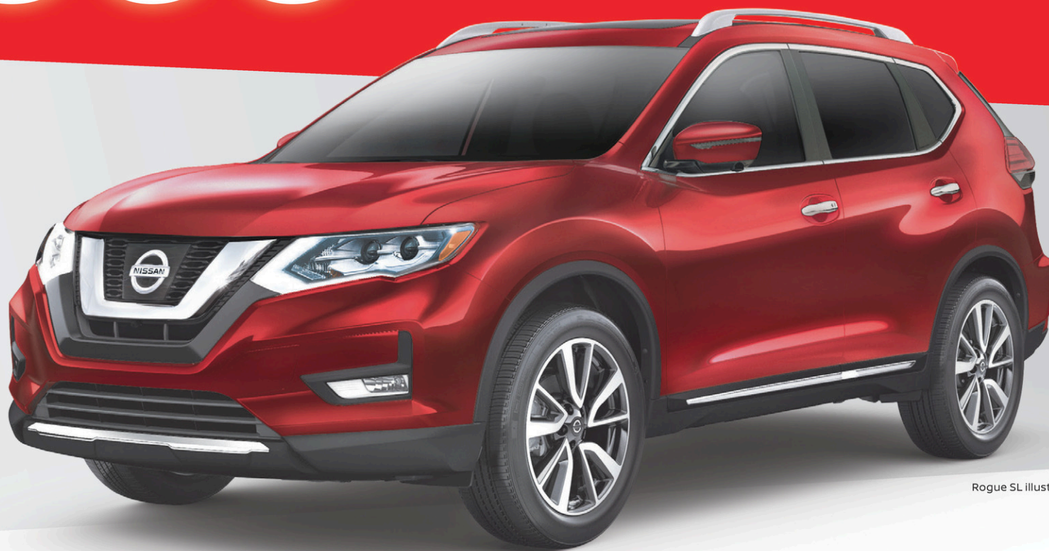
Rogue SL illustré