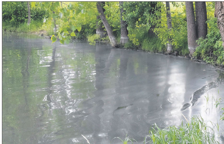
Lundi, une pellicule recouvrait la surface de l'eau à la hauteur du poste de pompage de la rue Loyola.

La Ville a deux postes de pompage à l'intersection des rues Loyola