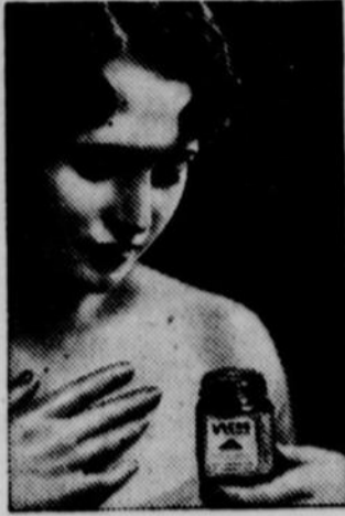
Mère! Les toux nocturnes des enfants peuvent être généralement enrayera par une application de Vicks. Frictionnez vivement et couvrez d'une flanelle chaude.

Quand un rhume descend sur la poitrine, ne courez pas de risques. Mettez-vous au lit et commencez le traitement Vicks à double action.