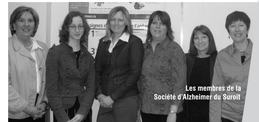
Les membres de la Société d'Alzheimer du Suroît