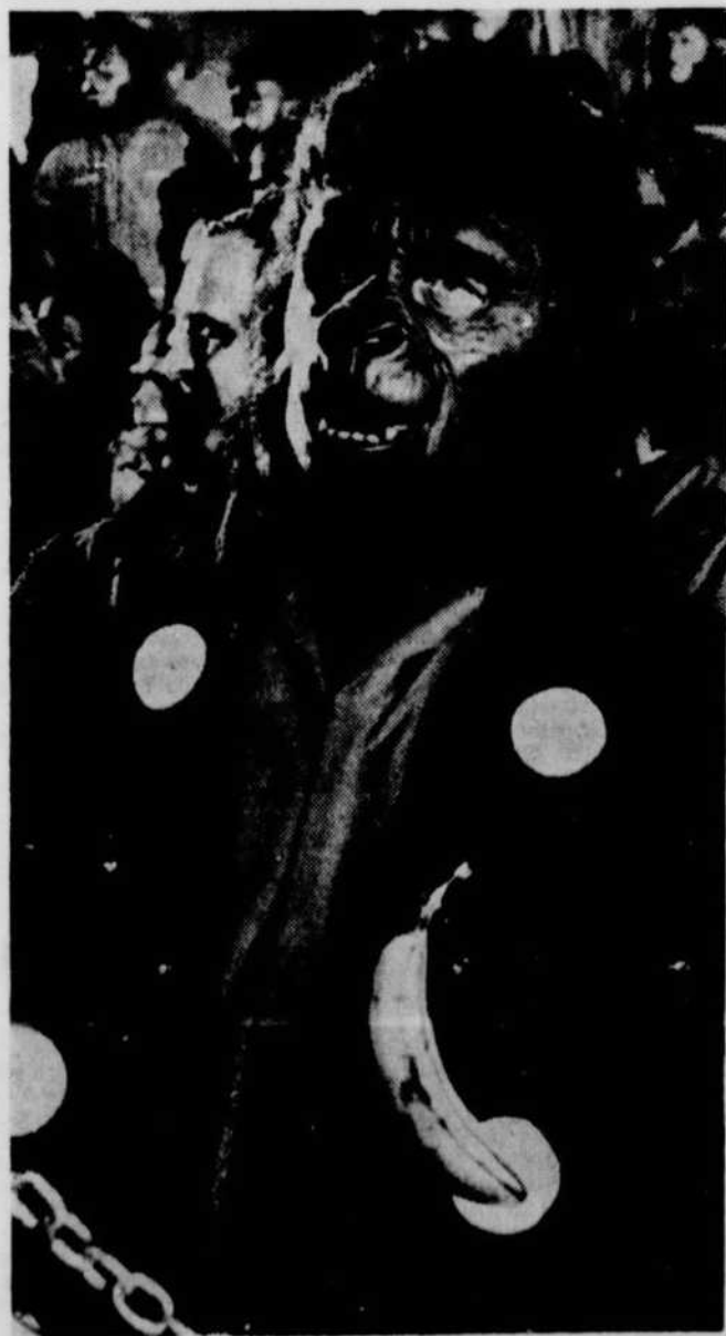
"La Conquête de la planète des singes" constitue le quatrième épisode de la série commencée avec "La planète des singes". Ce film est basé sur le célèbre roman de Pierre Boulle. ■

CANADIEN — "Un filic" sur semaine à 7.00 et 9.00 Samedi et dimanche à 1.00, 3.00, 5.00, 7.00, 9.00.