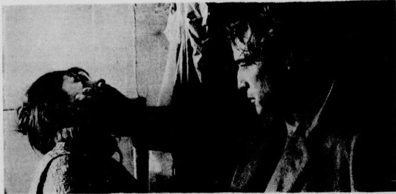
Dans le film "Le dernier tango à Paris" Marlon Brando trouve l'occasion d'une remarquable création même si le scénario donne lieu à un dialogue cru et à des scènes très audacieuses.

Ce dépliant est à conserver toute la semaine pour de bonnes informations sur les films qui passent dans nos salles de cinémas et sur les émissions de télévision.