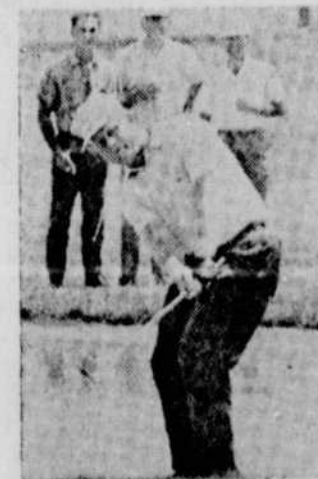
Dans le cadre de l'émission l'Univers des sports, présenté à Radio-Canada samedi et dimanche à 16h.00, vous pourrez voir évoluer les meilleurs joueurs de golf comme Jack Nicklaus, Arnold Palmer et plusieurs autres.