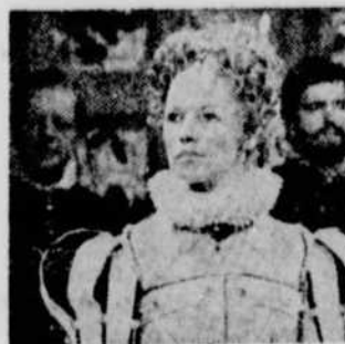
La vie d'Elisabeth Ière, présenté cet automne à Radio-Canada dans le cadre d'une nouvelle émission, "Hors-séries", tous les vendredis à 20h.30. ■