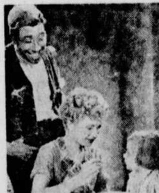
"La fille du puisatier" présentée au Cinéma du samedi 26 juillet à 24h.00 met en vedette outre Fernandel, Raimu, Charpin et Josette Day.