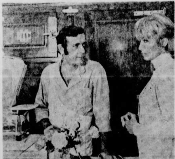
"Quai des Orfèvres" sera le titre du film présenté à l'émission Cinéma le vendredi 10 août à 23h.30. Bernard Blier, Suzy Delair et Louis Jouvet en seront les principaux interprètes.