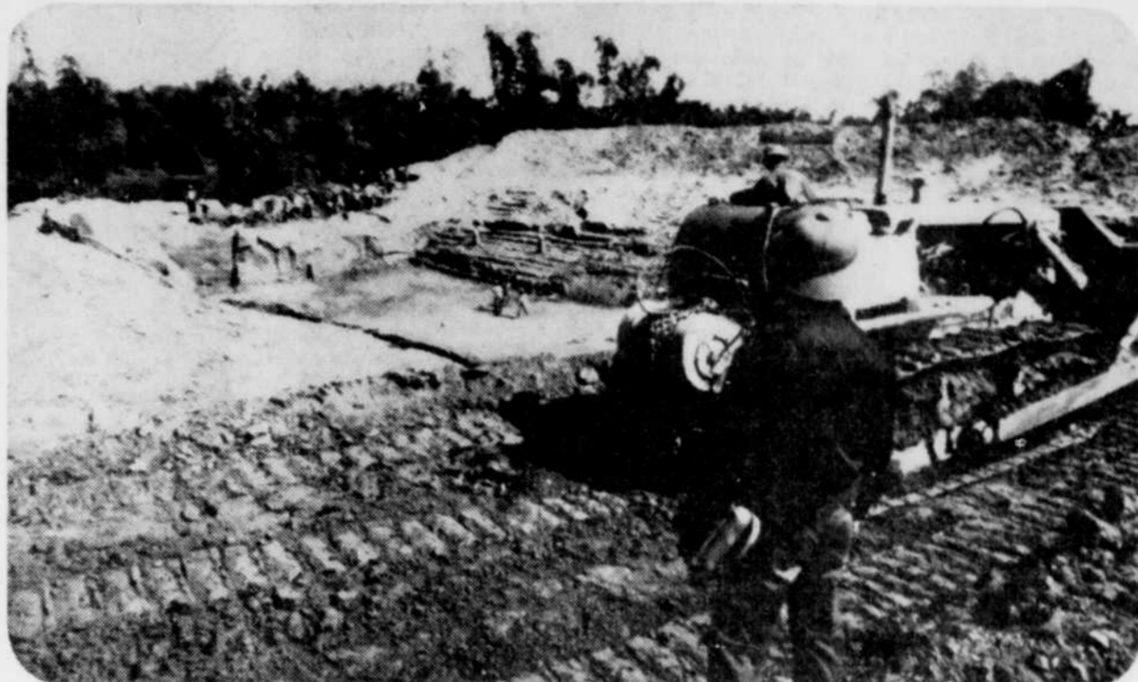
Après deux semaines pendant lesquelles une délégation de Mennonites a visité le Vietnam, les membres de cette délégation ont eu l'impression que ce pays est déterminé à définir le socialisme conformément à ses propres besoins, et qu'il souhaite établir des relations avec les pays occidentaux, particulièrement avec les États-Unis. Lors d'une visite à un chantier de construction, les Vietnamiens ont invité les Mennonites à fournir le ciment et les transformateurs pour une station-service.

Bien sûr, il se passe certainement au Vietnam beaucoup plus de choses que ce qu'on peut voir une petite délégation en quelques semaines. Mais les indices recueillis laissent espérer une orientation beaucoup plus ouverte et plus occidentale que ce à quoi on aurait pu s'attendre en avril 1975.