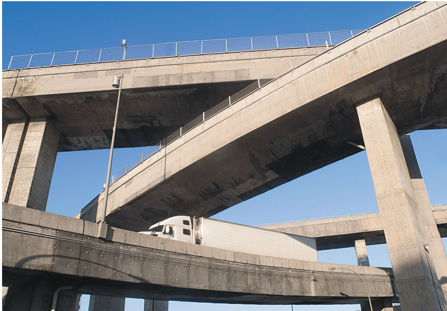
PEDRO RUIZ LE DEVOIR

L'augmentation de 1,5 milliard par an des dépenses en infrastructures sera vraisemblablement mise de côté par le gouvernement Couillard au dépôt du budget, mercredi.