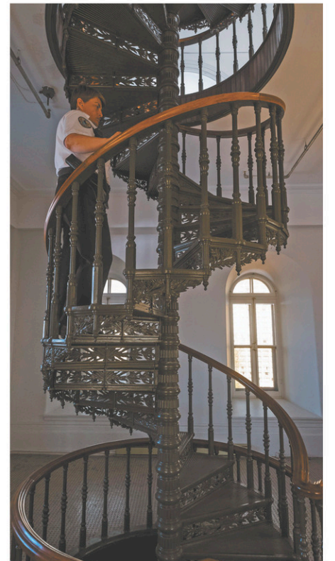
Les 185 marches de l'escalier de la tour centrale du parlement permettent de passer au milieu des anciens locaux de la Tribune de la presse.

Peinture écaillée, tapis rapiécé, ventilation bruyante : le Salon bleu doit se refaire une beauté, estime le président sortant de l'Assemblée nationale, Jacques Chagnon. S'il est approuvé, le projet