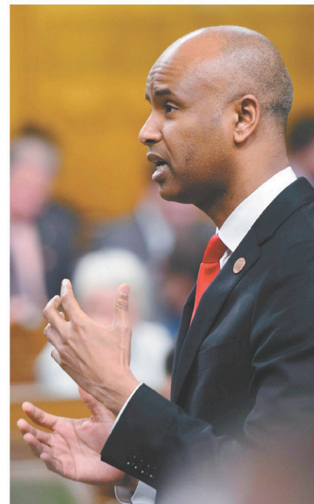
Le ministre fédéral de l'Immigration, Ahmed Hussen

Le nombre de demandeurs d'asile qui franchissent la frontière canado-américaine de manière irrégulière est en baisse constante. Selon de nouveaux chiffres dévoilés vendredi, la Gendarmerie royale du Canada en a intercepté 1263 en juin, comparativement à 1869 le mois précédent. En avril, 2560 demandeurs du statut de réfugié avaient été dénombrés par la GRC.