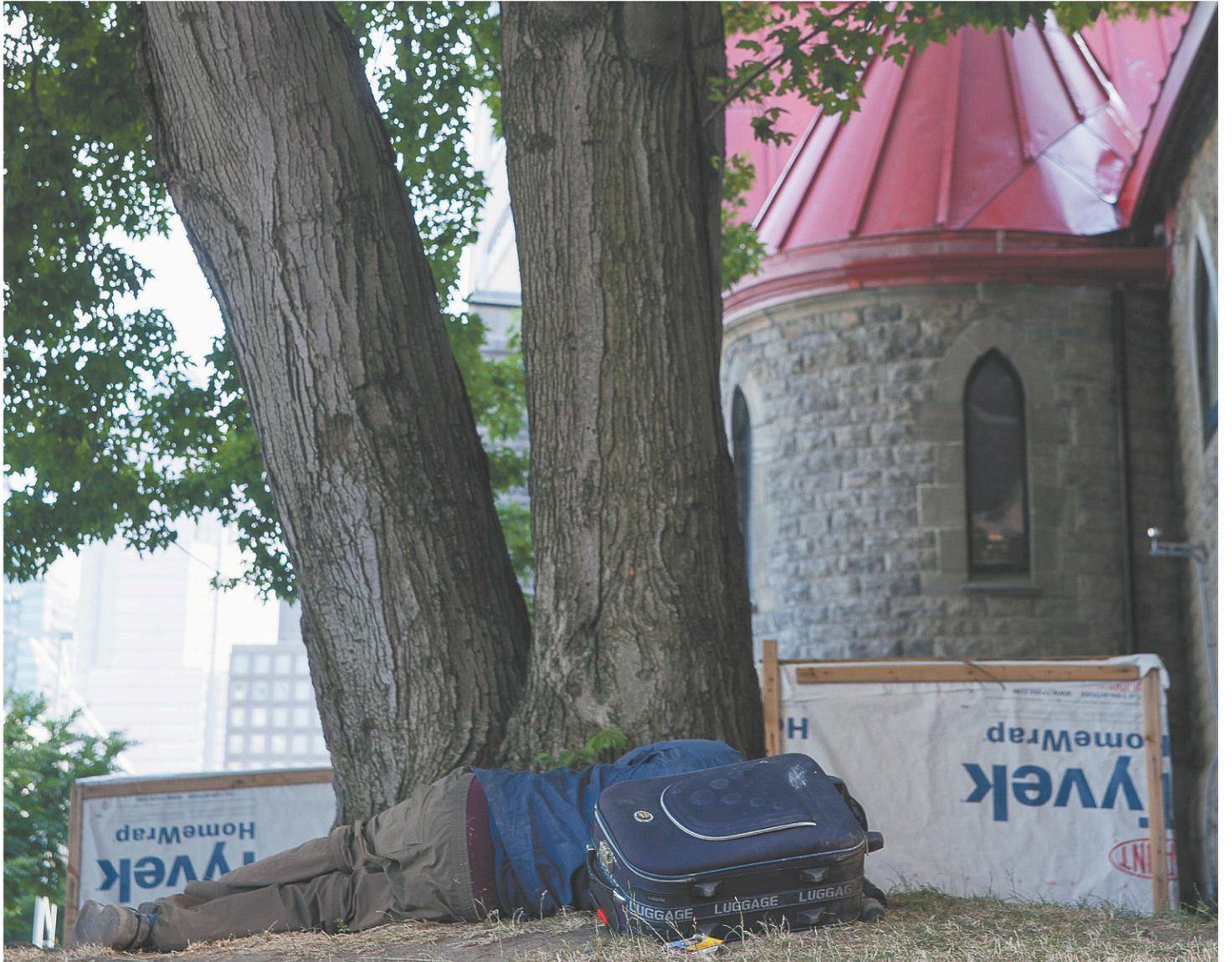
Après 91 ans d'existence, la Mission Saint-Michael se retrouve au bord du gouffre. Deux fondations ont décidé de retirer leur financement à l'organisme de l'avenue Président-Kennedy, préférant contribuer à des programmes de logements pour itinérants.