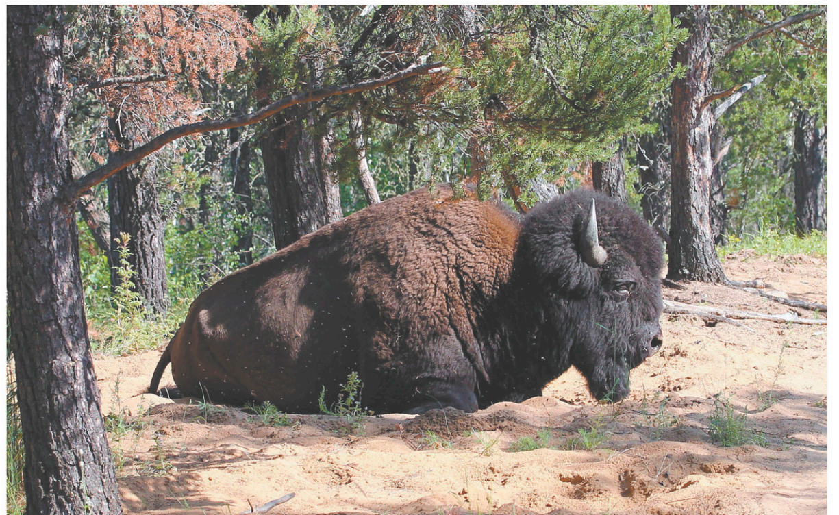
L'étude fédérale a été conduite en raison des inquiétudes soulevées à l'égard du statut de patrimoine mondial de l'UNESCO du parc. En photo: un bison dans le parc Wood Buffalo, en Alberta.