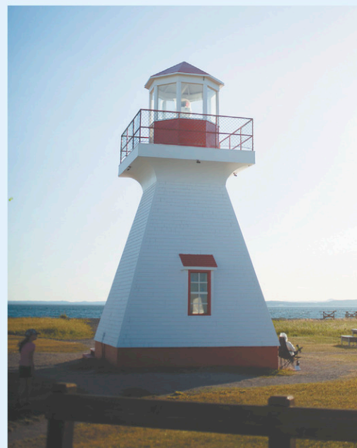
Le phare de Carleton-sur-Mer