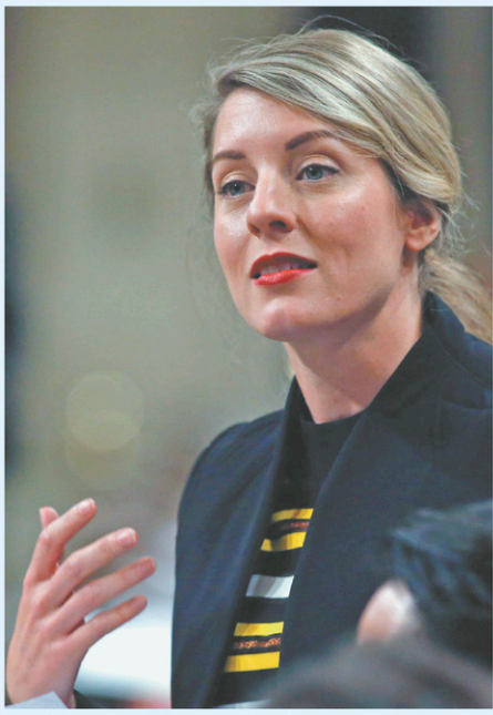
La ministre du Patrimoine canadien, Mélanie Joly