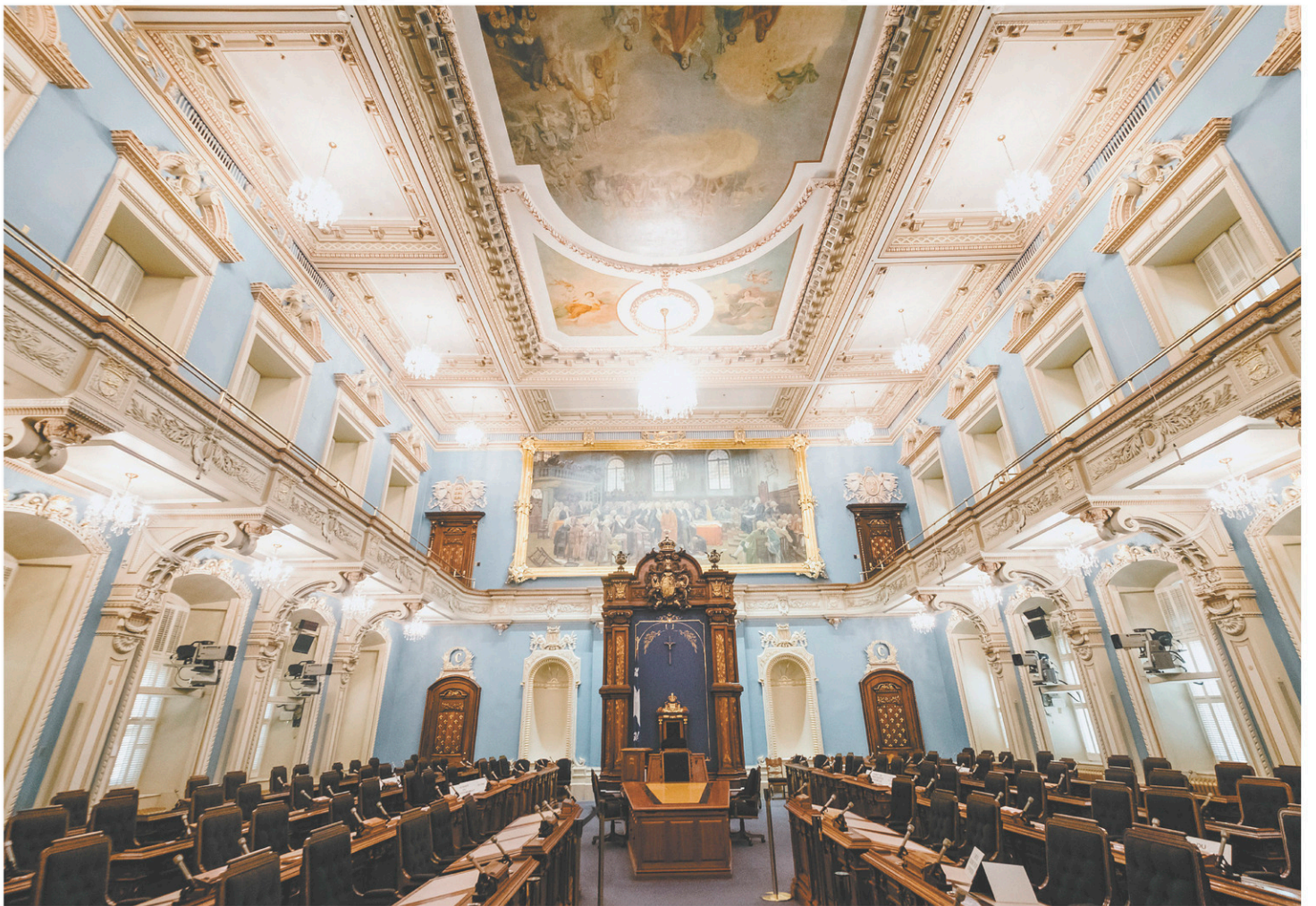
Le 8 avril 1886, les parlementaires font leur entrée au Salon bleu (notre photo), dont les murs sont alors verts. Ils sont repeints en 1978 pour améliorer la télédiffusion des débats.

La Puissance du Canada célèbre tout juste son cinquantième anniversaire, en 1917, lorsque le député de Lotbinière, Joseph-Napoléon Francœur, annonce qu'il présentera au Salon vert une motion exprimant l'avis « que la province de Québec serait disposée à accepter la rupture du pacte confédératif de 1867 si, dans les autres pro-