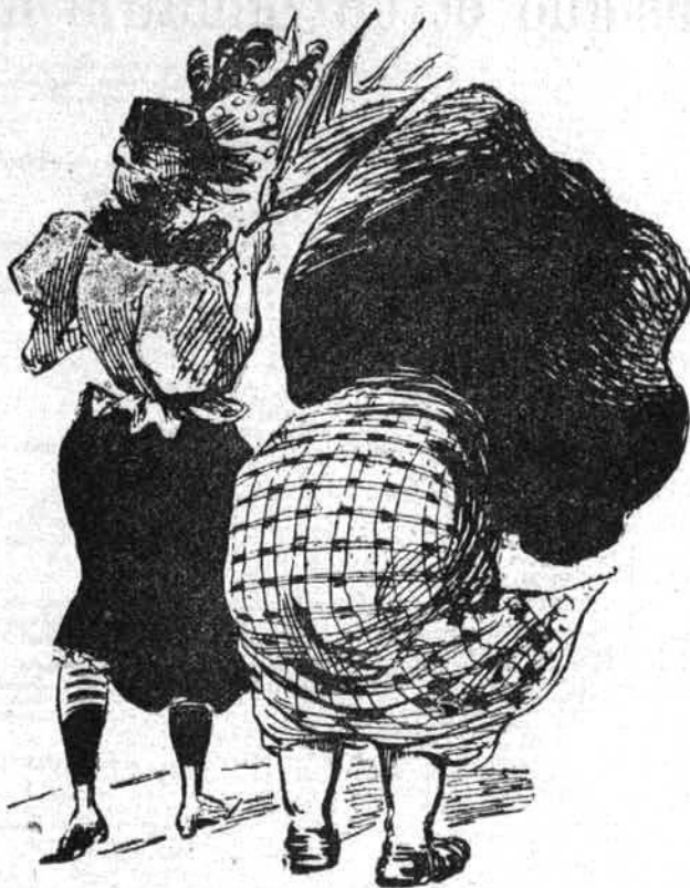
— Courage, ma fille, c'est par un vent comme celui-là que j'ai fait la con- naissance de ton défunt père.