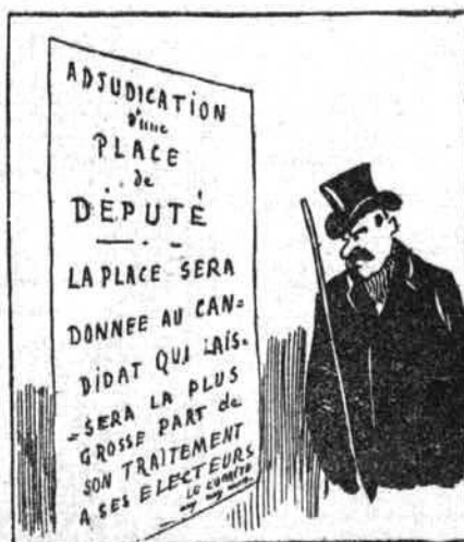
Nouvelles mœurs électorales.