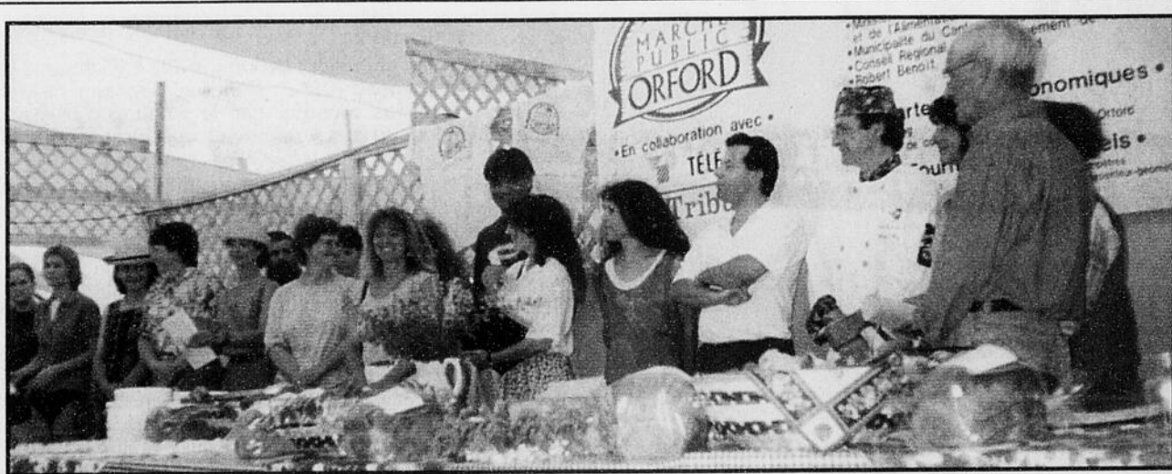
Selon plusieurs intervenants de la région de Magog, le Marché public Orford qui ouvrira son chapiteau aux gourmets demain à Cherry River constituera un attrait touristique original ainsi qu'un précieux outil de promotion des produits agricoles et des créations des artisans de l'alimentation des Cantons de l'Est.