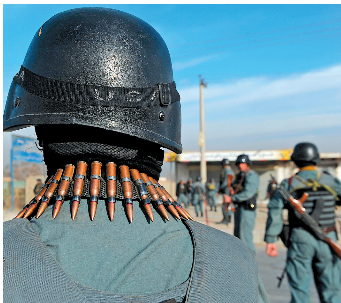
Soldats afghans à Kaboul sur les lieux d'un des deux attentats, hier, en Afghanistan