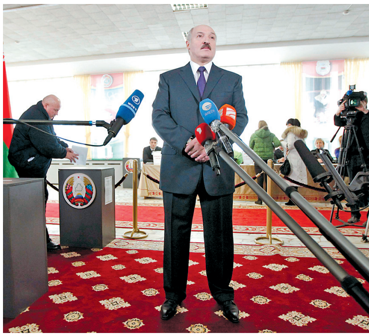
Alexandre Loukachenko, en conférence de presse, hier

dages à la sortie des bureaux de vote annoncés par la télévision biélorusse, Loukachenko obtiendrait entre 72,2 et 81,4 % des suffrages, devançant largement ses principaux opposants, Andreï Sannikov et Vladimir Nekliaev.