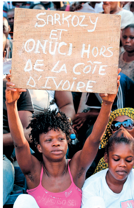
LUC GNAGO REUTERS