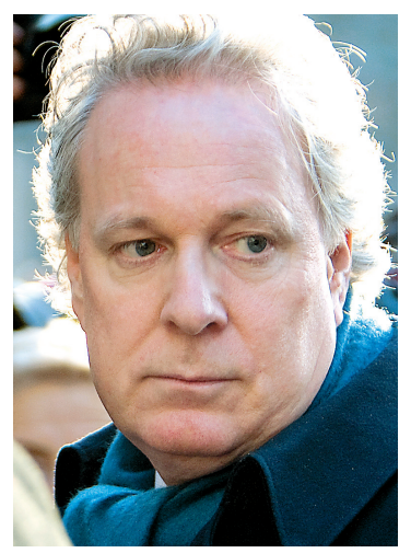
Le premier ministre du Québec, Jean Charest