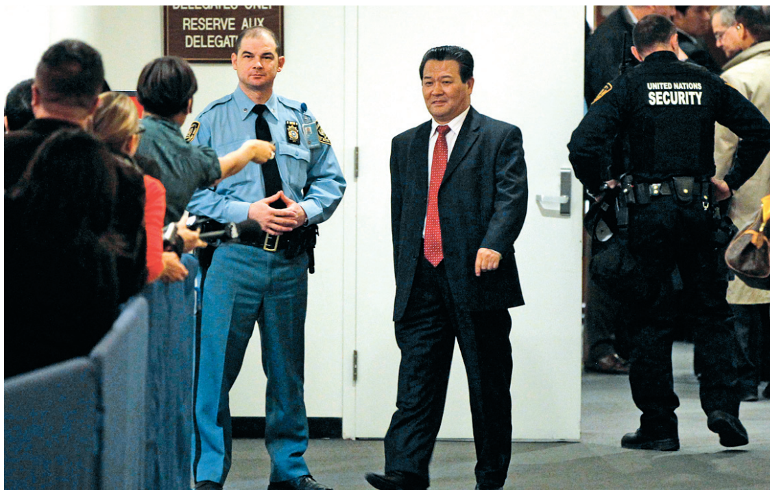
L'ambassadeur nord-coréen aux Nations-unies, Sin Son-ho, lors de la séance extraordinaire du Conseil de sécurité, hier à New York.