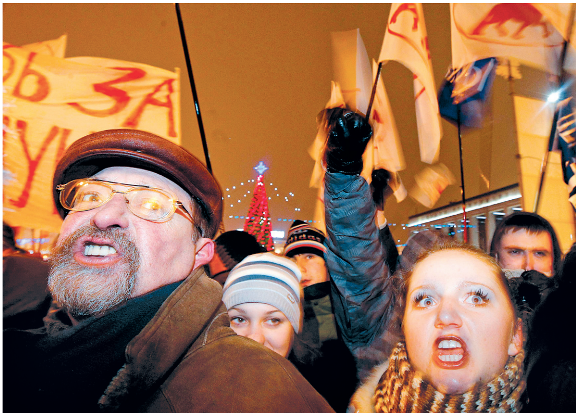
Des milliers de Biélorusses ont manifesté hier soir à Minsk, la capitale, contre la réélection d'Alexandre Loukachenko, qualifié de «dernier dictateur d'Europe» par l'ex-président George Bush.