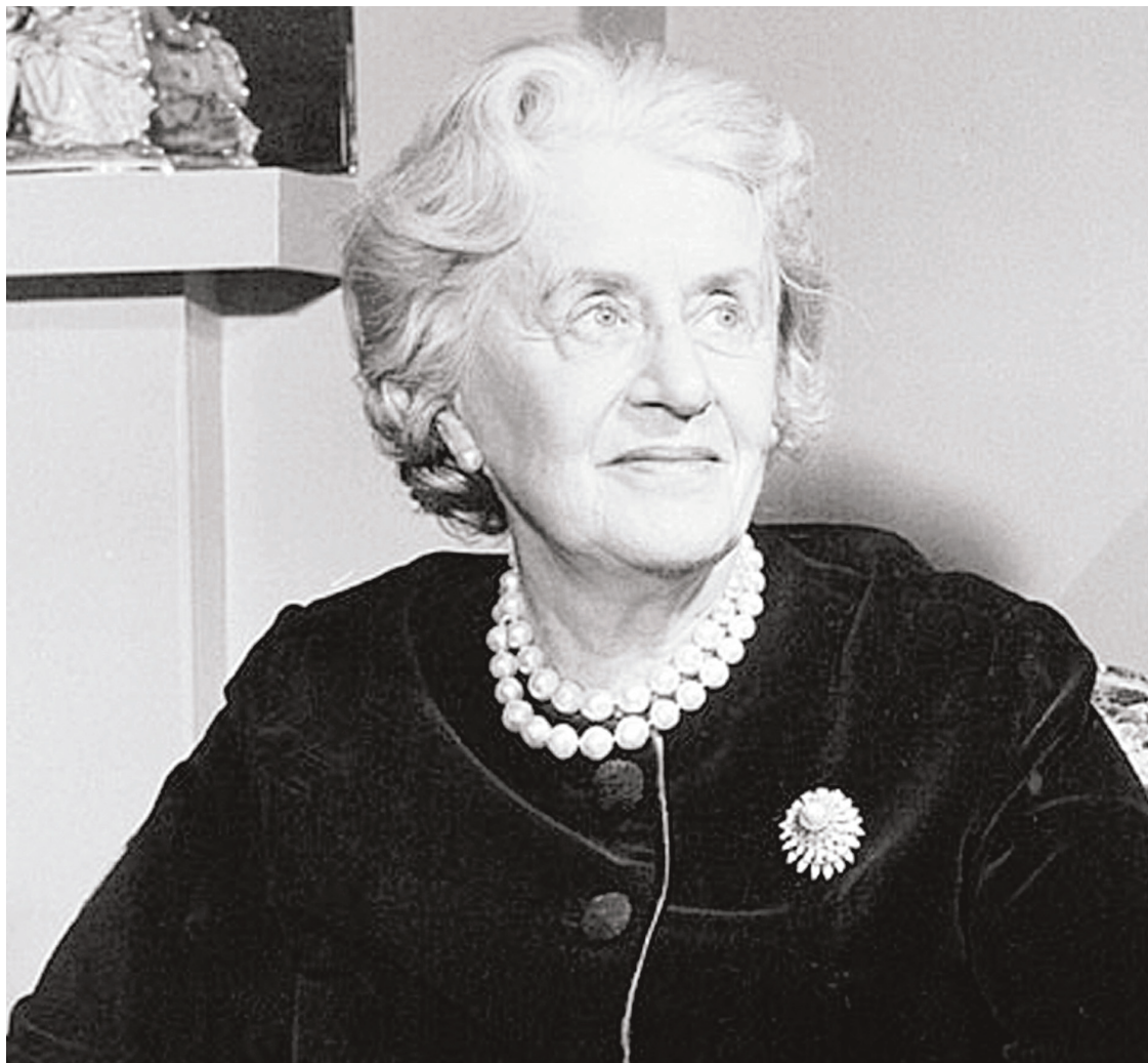
Thérèse Casgrain cadre mal avec la conception « sélective et étriquée » de l'histoire canadienne telle qu'elle est vue par Stephen Harper, estime le député Stéphane Dion.

ignore le 30 e anniversaire de la Charte cana-