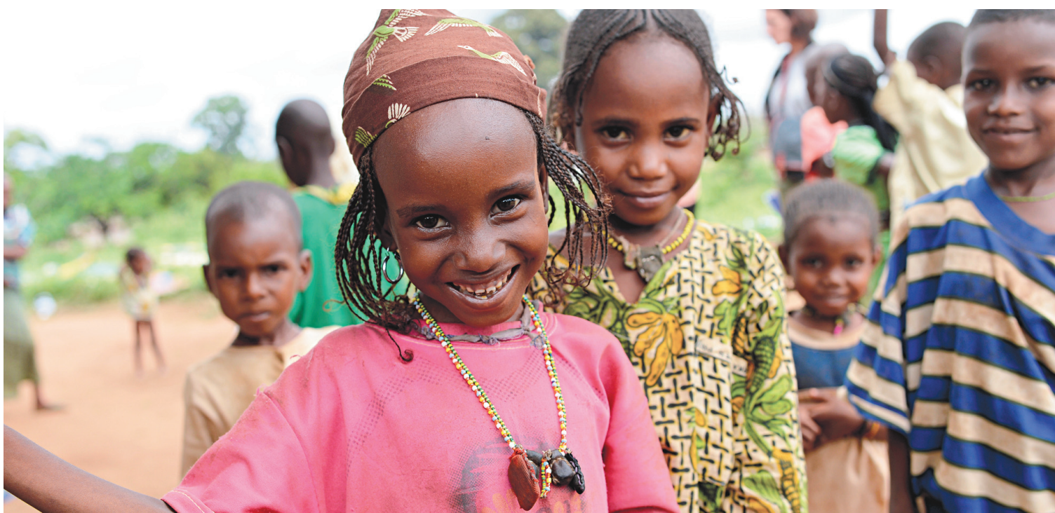
L'UNICEF appelle à investir massivement dans les secteurs de la santé et de l'éducation, en particulier pour les filles.