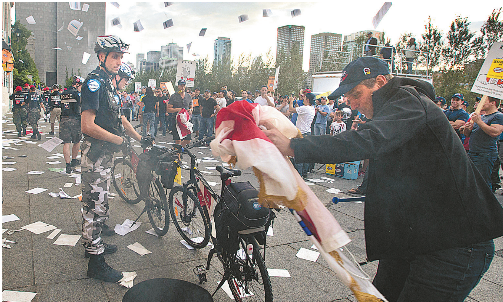
Des centaines de syndiqués ont pris d'assaut l'hôtel de ville de Montréal lundi en début de soirée.