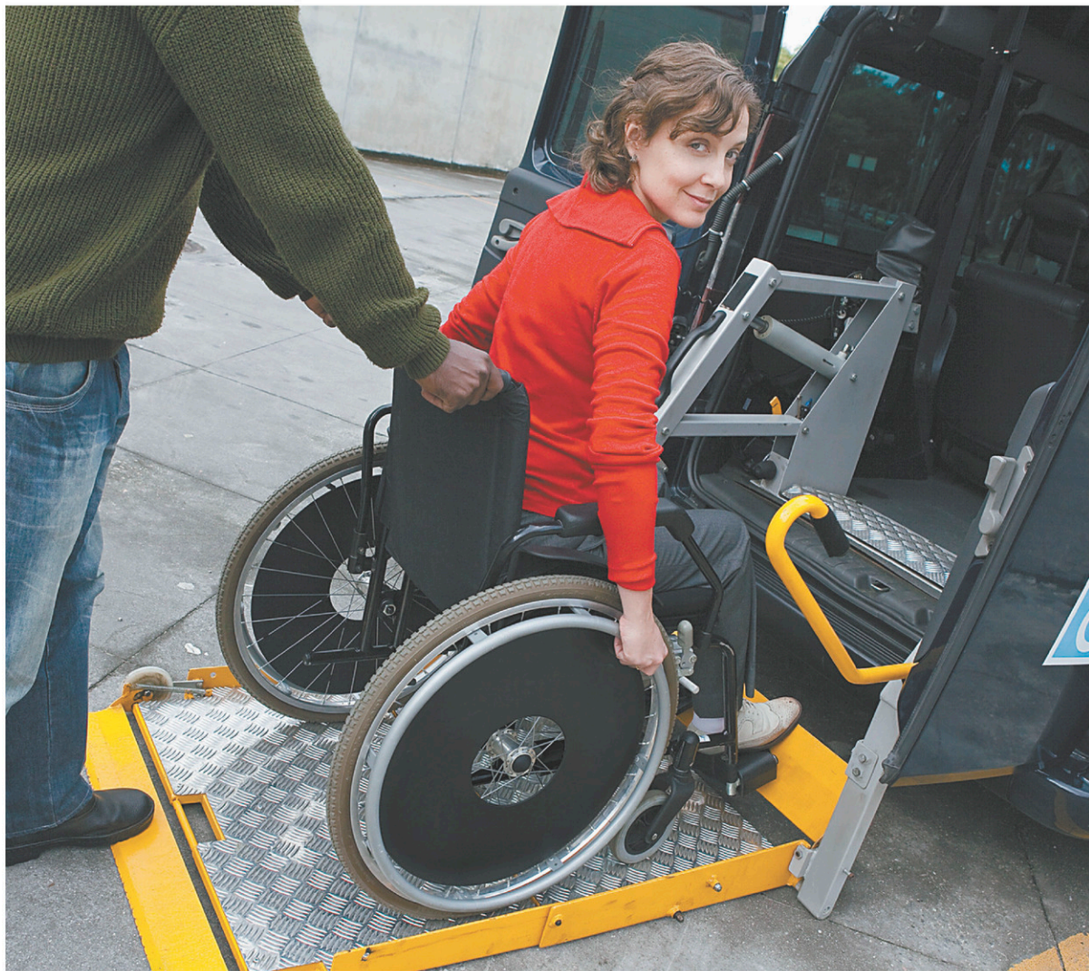
Près des trois quarts des 120 000 personnes qui ont droit au transport adapté au Québec utilisent les taxis embauchés par les sociétés de transport municipales.