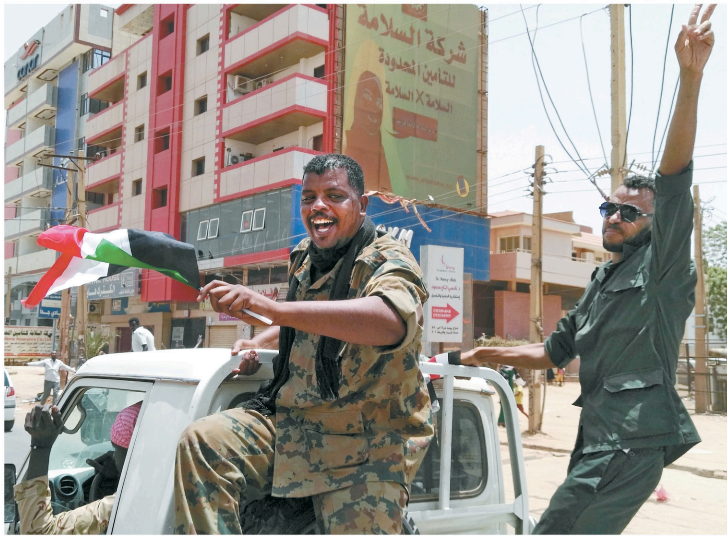
La nouvelle a été accueillie comme une victoire, à Khartoum, par des membres des forces de sécurité.

La déception des Soudanais jeudi après-midi à l'annonce du communiqué des militaires a été à la hauteur de leur joie au réveil puis de leur nervosité grandissante. Car la journée a été très longue pour eux. Dès 5h, l'information circule sur des véhicules blindés pénétrant le complexe présidentiel où se trouvent la résidence personnelle d'Omar el-Béchir et le quartier général de l'armée. Peu après, confirmant les premières rumeurs d'un départ du président, la télévision nationale interrompt ses programmes pour diffuser