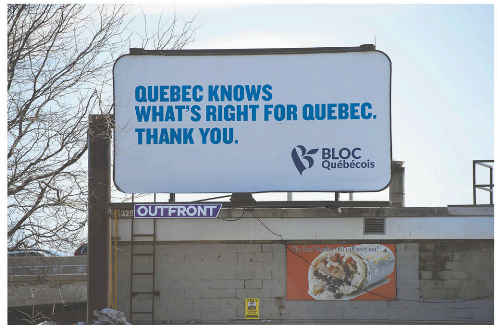
Le panneau publicitaire que s'est offert le Bloc québécois.

Le Bloc québécois se targue d'être le seul parti politique fédéral à appuyer la loi du gouvernement de François Le-