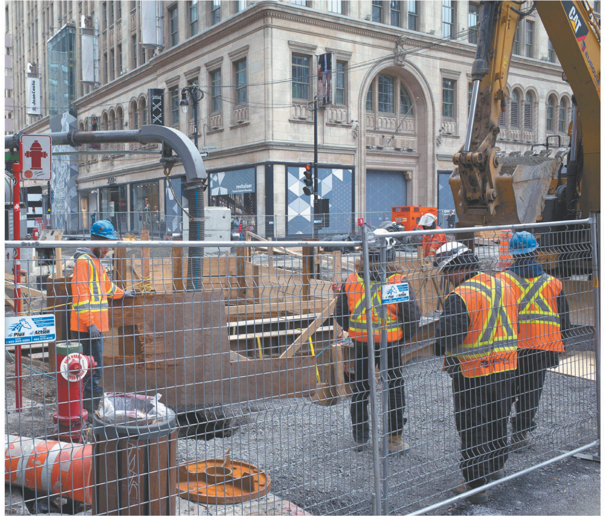
Parmi les grands chantiers figurent ceux de la rue Sainte-Catherine Ouest, entre les rues de Bleury et le boulevard Robert-Bourassa.

Promise en campagne électorale, cette escouade sera composée de six personnes et effectuera des visites-surprises sur les chantiers. Afin de s'assurer que les exigences techniques de la Ville sont