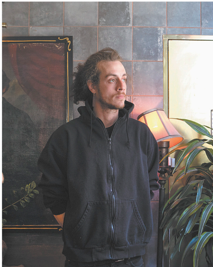
Sur ce premier album, Ogden a rangé la voix nasillarde de Robert Nelson pour adopter un ton plus grave et moins caricatural.

Sur ce premier album d'ailleurs, Ogden a rangé, pour ainsi dire, la voix nasillarde de Robert Nelson pour adopter un ton plus grave et moins caricatural. La transformation avait déjà été amorcée sur le dernier album d'Alclair ( Le sens des paroles , paru il y a moins d'un an), elle est aujourd'hui achevée.