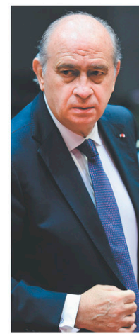
Jorge Fernandez Diaz

Le premier ministre espagnol Pedro Sanchez a nié « catégoriquement » mercredi que ces pratiques aient perduré depuis qu'il a pris le pouvoir en juin dernier.