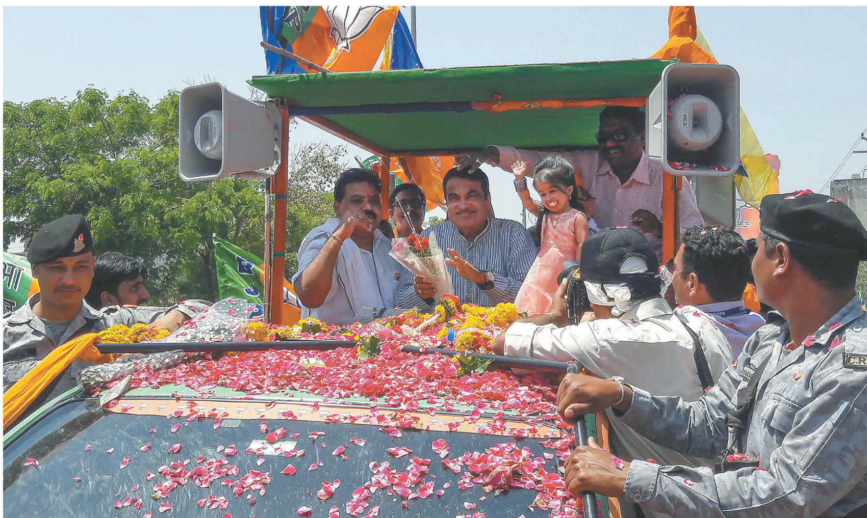
Le candidat local du parti BJP à Nagpur, Nitin Gadkari, accompagné de Jyoti Amge, considérée comme la plus petite femme au monde, est salué par ses partisans à l'occasion d'un défilé politique.