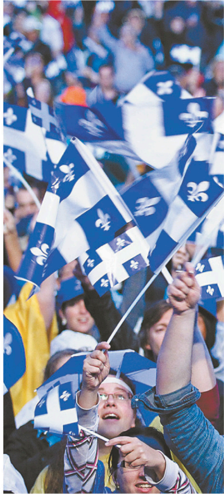
YAN DOUBLET LE DEVOIR

Il en va tout autant de la disposition de dérogation dont l'usage par le Québec incarne pour le Canada la volonté québécoise de faire bande à part et de s'attaquer à des droits fondamentaux.