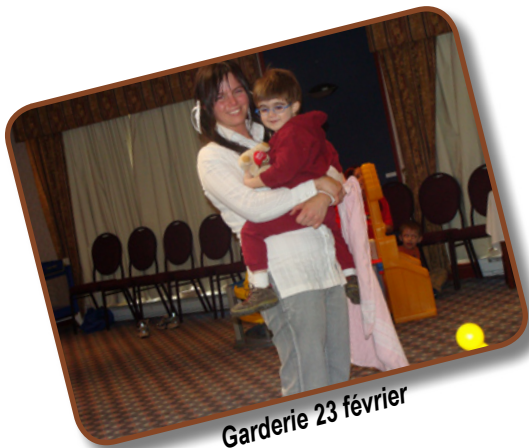
Garderie 23 février

Les tout-petits de la halte-garderie sont confiés à une équipe de personnes spécialisées en petite enfance du Centre communautaire Saint-Jean-Baptiste-de-Drummondville et son CPE Le Papillon Enchanté.