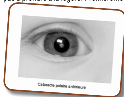
Cataracte polaire antérieure

Bref, la cataracte chez l'enfant n'est certes pas à prendre à la légère. Premièrement,