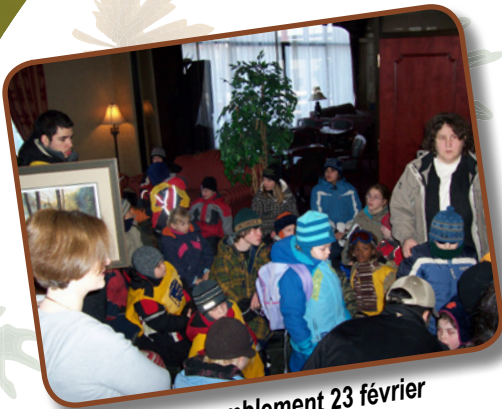
Rassemblement 23 février

Grâce à la contribution de la Fondation des aveugles du Québec les jeunes peuvent participer à des activités de grande qualité avec un encadrement sécuritaire. L'équipe de bénévoles est dynamique et bien entraînée..