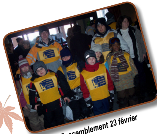
Rassemblement 23 février