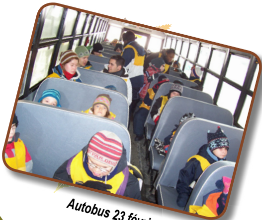
Autobus 23 février