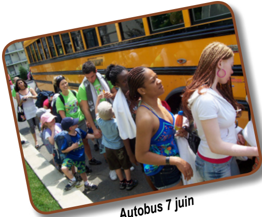
Autobus 7 juin