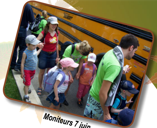
Moniteurs 7 juin

Les tout-petits de la halte-garderie sont confiés à une équipe de personnes spécialisées en petite enfance du Centre communautaire Saint-Jean-Baptiste-de-Drummondville et son CPE Le Papillon Enchanté.