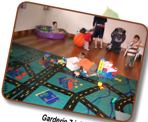
Garderie 7 juin