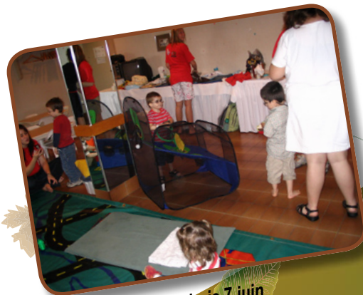
Garderie 7 juin