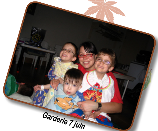
Garderie 7 juin