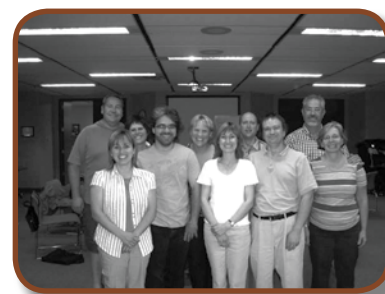
Groupe Longueuil 1

Les groupes demeurent ouverts à recevoir de nouveaux membres. Il existe aussi d'autres groupes dans d'autres régions. Si vous désirez briser l'isolement et rechercher des ressources dans tous les domaines, n'hésitez pas à vous joindre à un groupe d'entraide. Vous pouvez communiquer avec l'AQPEHV pour plus d'informations.