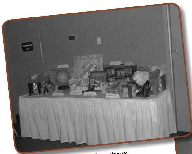
Photo: Table cadeaux

Après le souper, l'équipe de la Fondation des aveugles du Québec s'est retirée avec les jeunes pour les divertir par le biais d'une soirée cinéma.