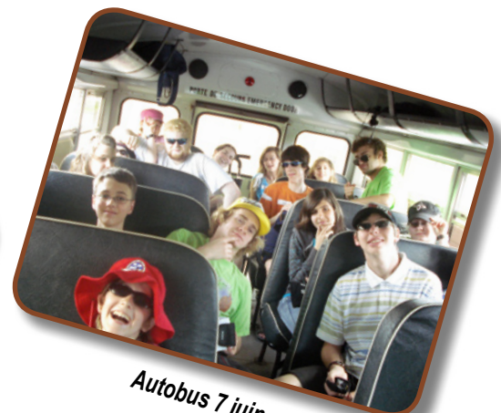
Autobus 7 juin