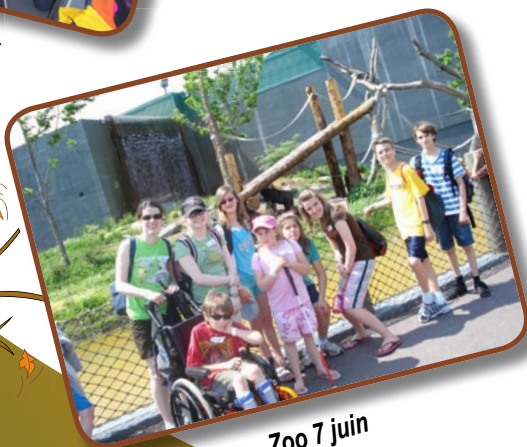
Zoo 7 juin