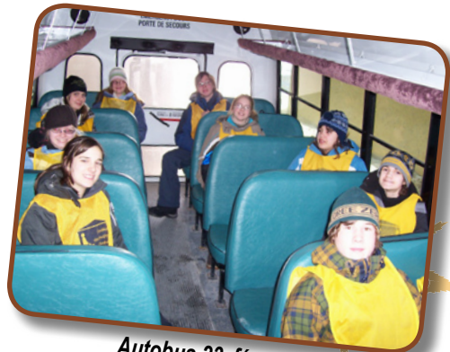
Autobus 23 février