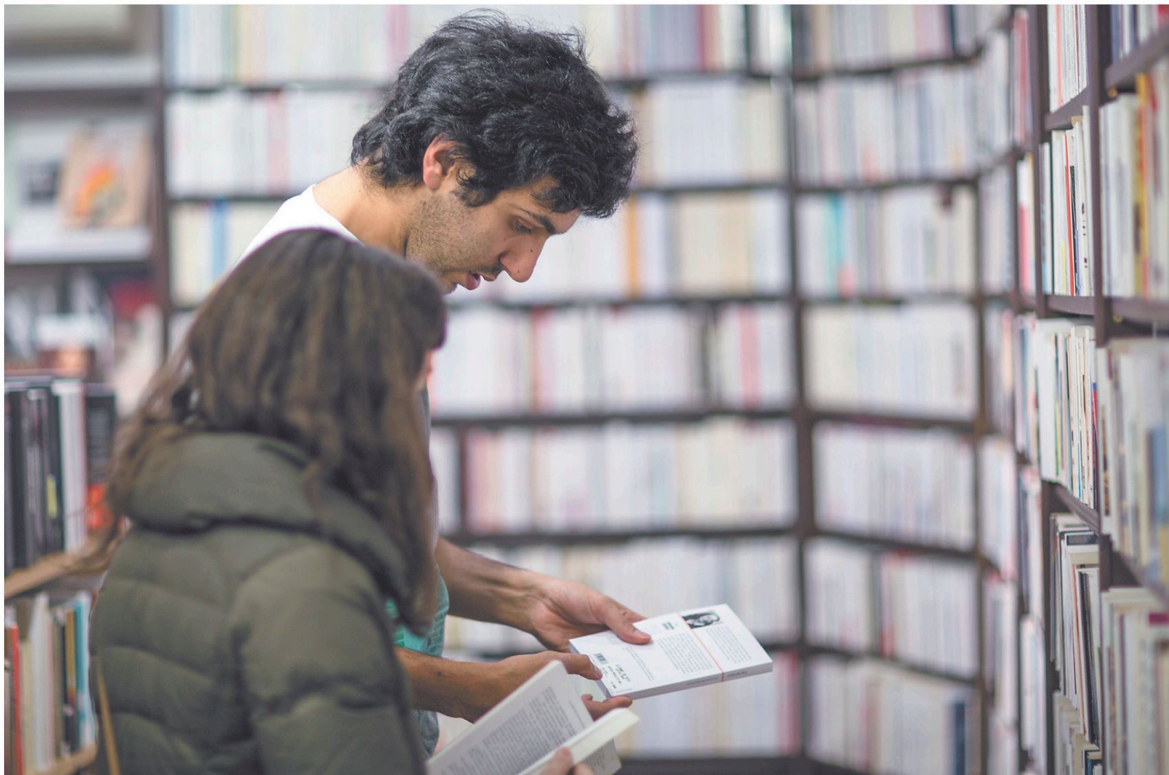
La littérature vient au second rang des ventes au Québec en 2018, derrière le livre jeunesse et devant le livre pratique.