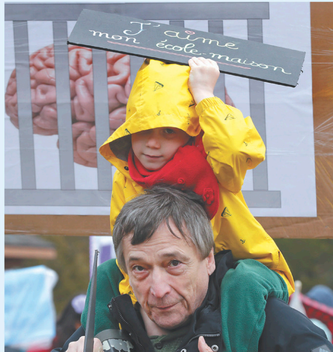
Les parents, certains accompagnés de leurs enfants, ont manifesté devant le bureau du ministre Jean-François Roberge, à Chambly.