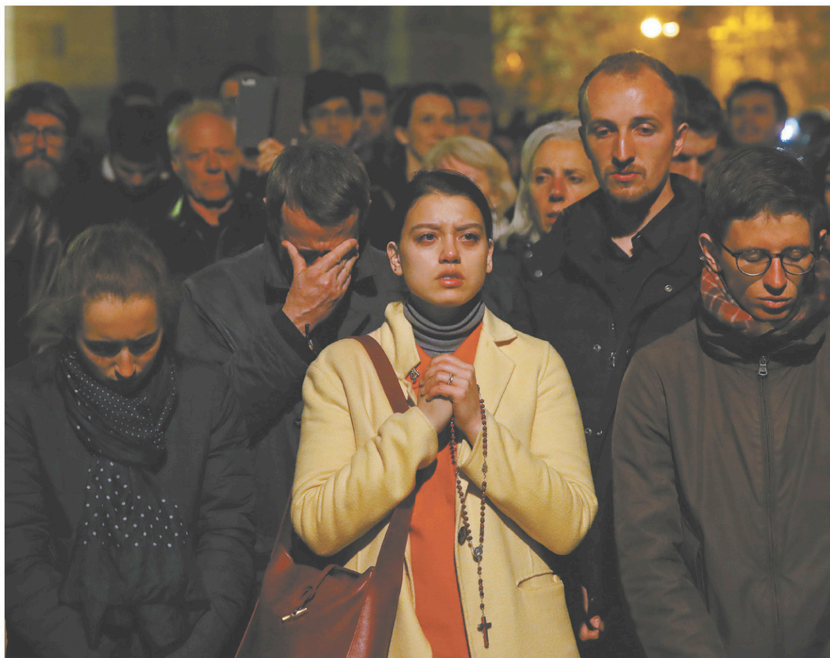
Catastrophés, les Parisiens ont regardé les flammes ravager la célèbre cathédrale.