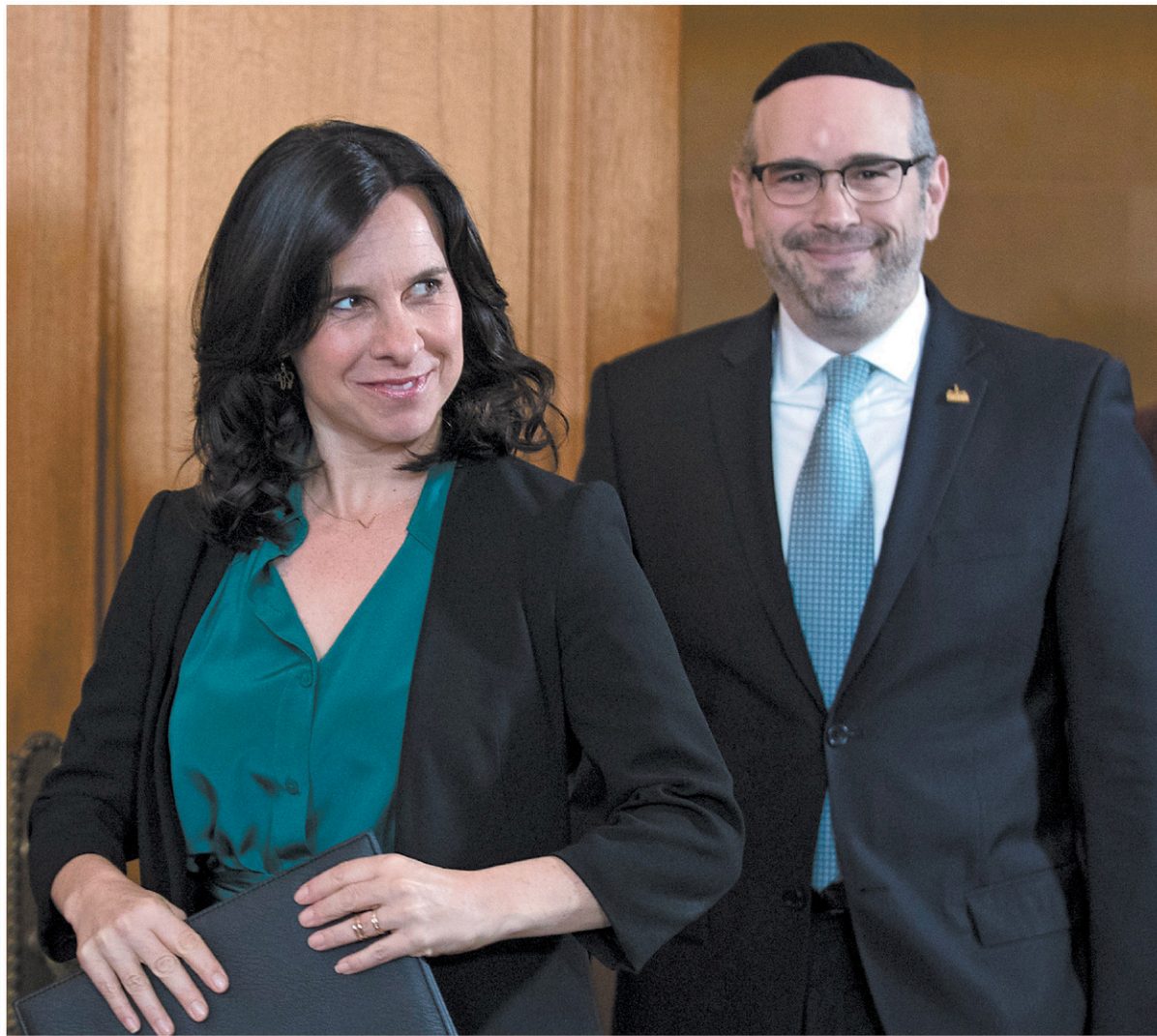
La mairesse Valérie Plante et le chef de l'opposition, Lionel Perez, ont fait une déclaration commune, lundi, en réaction au projet de loi 21. Cette déclaration prône une « laïcité ouverte » et accorde un soutien « indéfectible » aux employés de la Ville à ce chapitre.

Lionel Perez estime qu'il est difficile pour une institution de lancer un appel à la désobéissance civile, mais il croit que le gouvernement doit être à l'écoute :