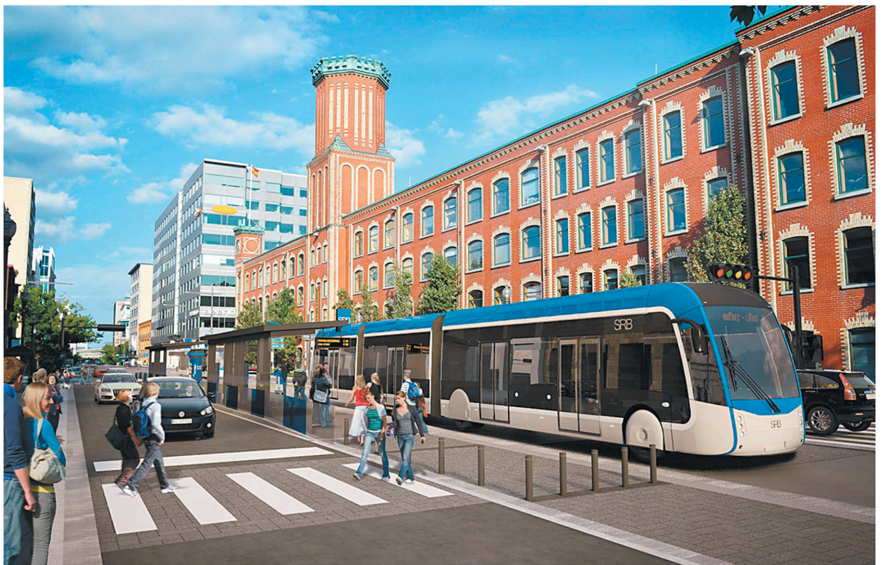
Selon l'échéancier soumis par la Ville de Québec, des tramways rouleront dans les rues de la capitale nationale en 2026.

le jeudi 18 avril de 17h à 21h ainsi que le vendredi 19 avril de 10h à 12h, un hommage par la famille suivra à 12h au salon même.