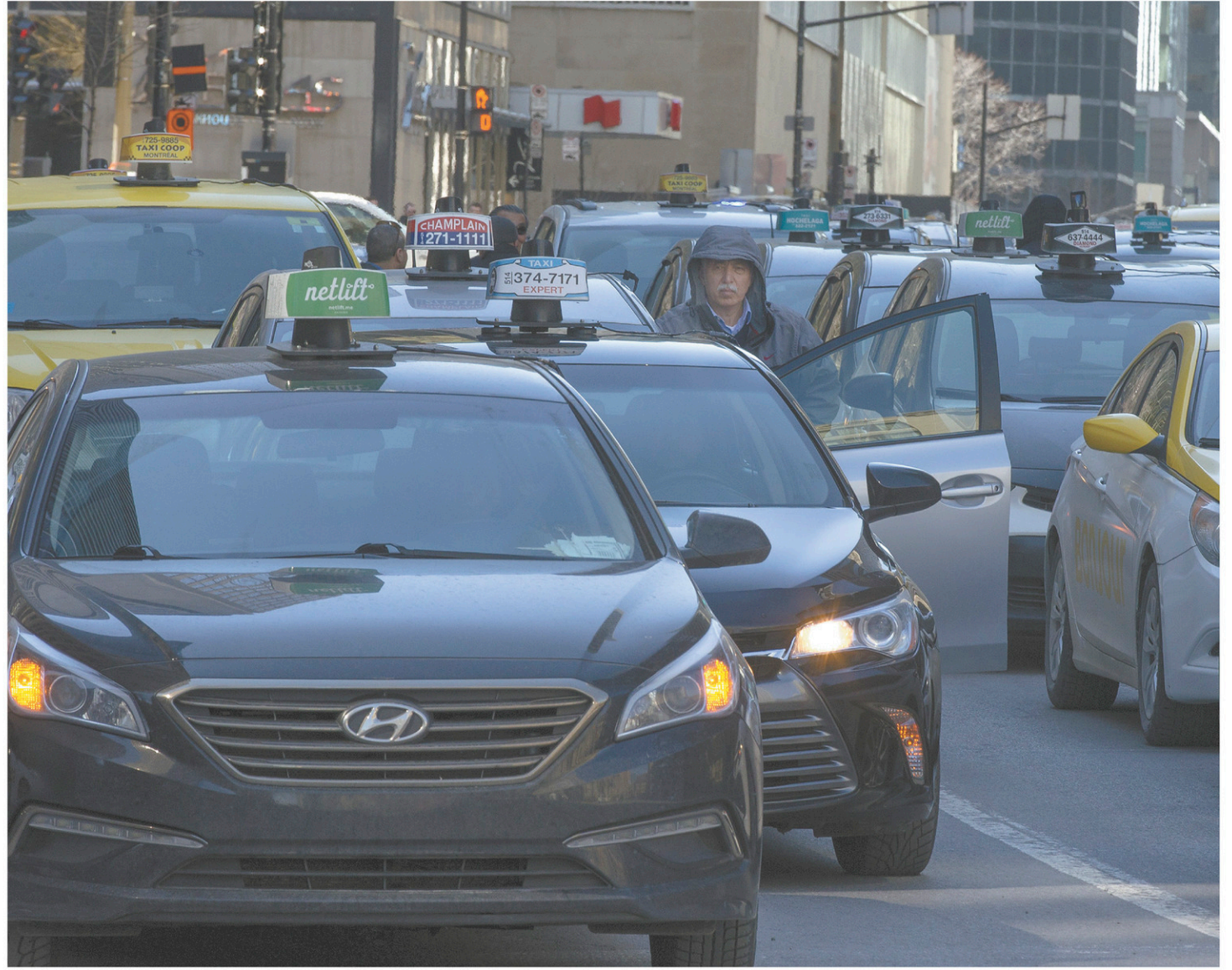
Québec offre de rembourser aux détenteurs d'un permis de taxi la somme qu'ils ont payée au moment de l'acquisition.

Tout le monde reconnaît que le français est une bien belle langue, qui contribue au charme du Québec et dont la connaissance ne peut qu'enrichir l'esprit, mais les nouveaux arrivants ont généralement des besoins plus pressants, par exemple gagner leur vie, et plusieurs semblent penser que l'anglais est plus utile