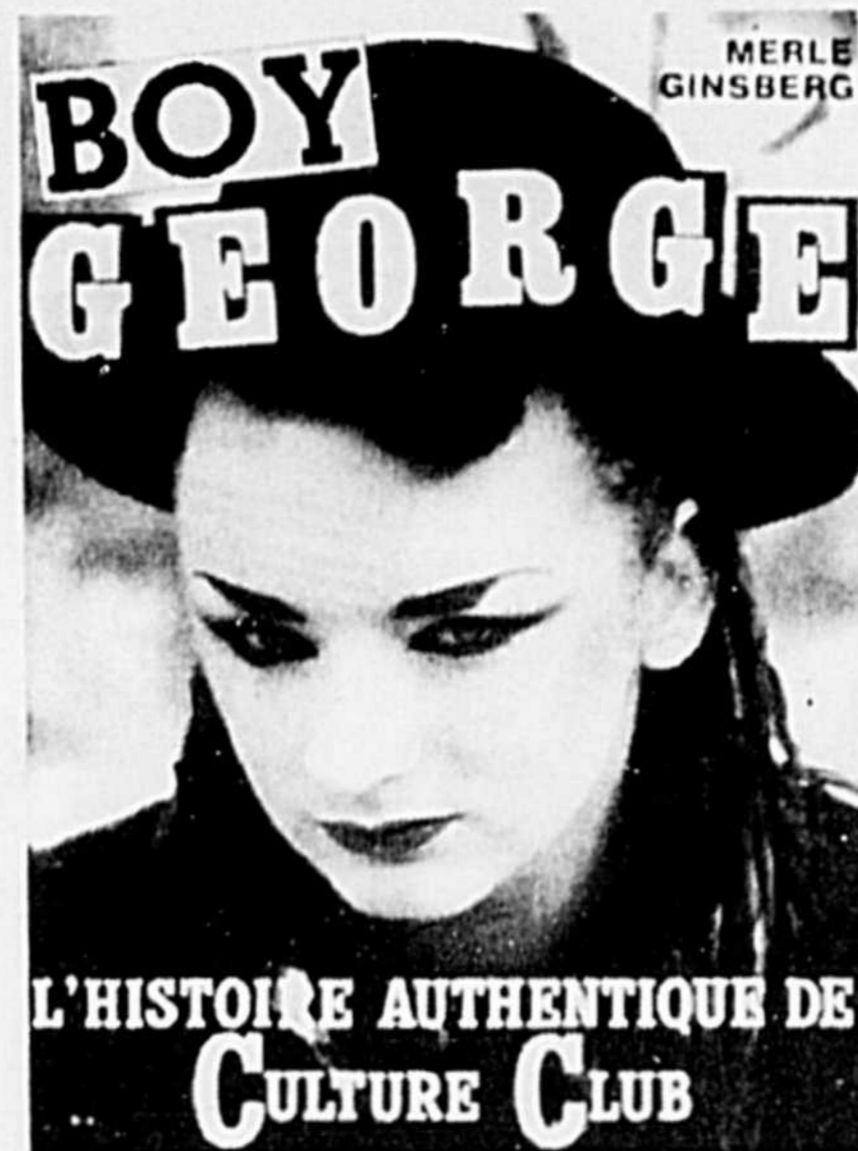
Merle Ginsberg. L'histoire authentique de Culture Club. Éditions de l'Homme. 148 pages. 1984.

Heureusement d'ailleurs, puisque la vie de Boy George, pour être intéressante, n'en est pas moins un peu décevante !