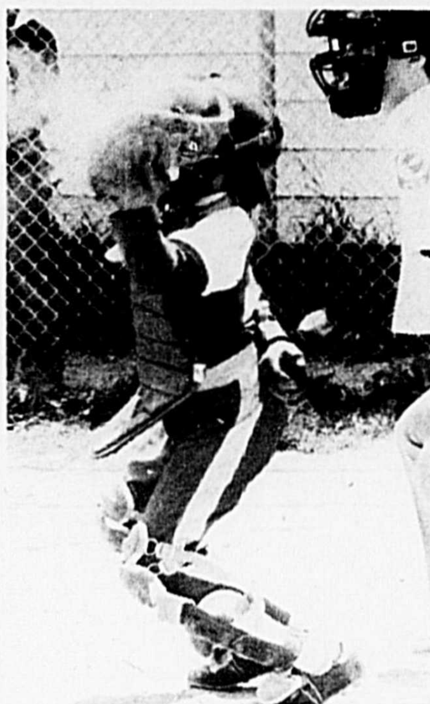
Un jeune "Gary Carter" en puissance ?