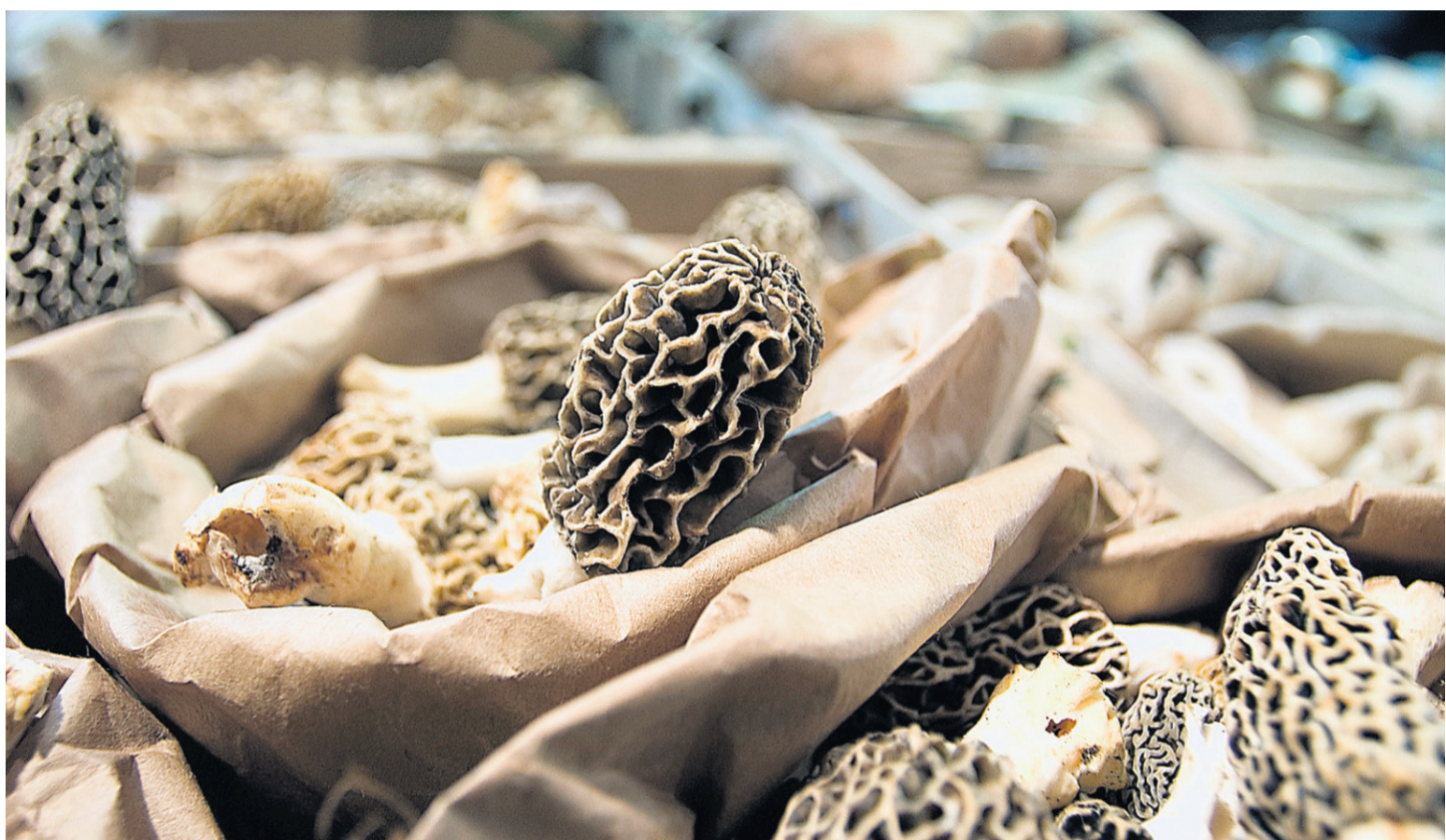
Morilles et autres champignons du printemps de Chez Louis, au marché Jean-Talon.

2$ pour un sachet de 20 g (suffisant pour 2 ou 3 portions de pâtes). En vente chez Milano, 6862, boulevard Saint-Laurent, (514) 273-8558.