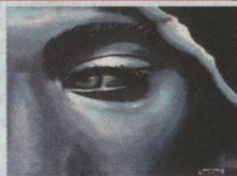
325 Me, myself and eye Tony Antoine 11"x14" 95,00$