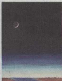
-A03- La Lune Eric Vilon 16"x20" 165,00$