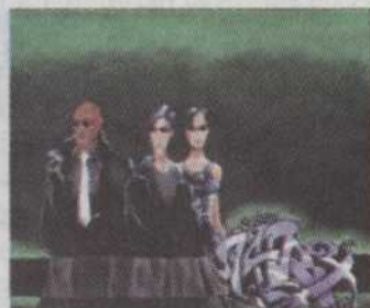
- A02 - matrix Tony Antoine 8"x10" 95,00$