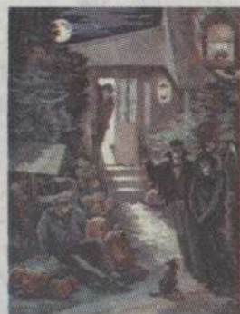
- 115 - Nuit d'Halloween Panin Victor 18"x24" 295,00 $