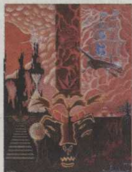
- 408 - Les Découvertes Céus Pierre 16"x20" 195,00 $