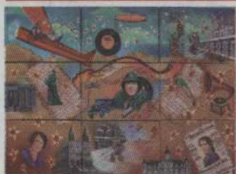
- 407 - La Bolduc Dalpay Luc 7 x 9' (9 toiles) 5 000$