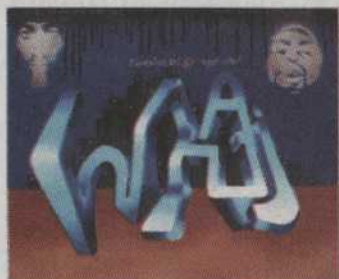
- 415 - Ce soir mes rimes sont sad 13th Prophet 16"x20" 195$