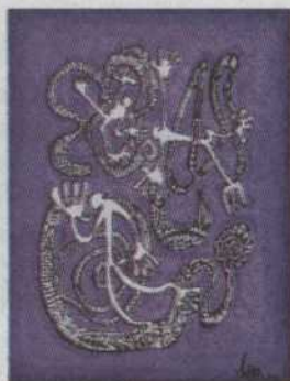
- A04 - Hommage à Haring Mathieu Kavanagh 16"x20" 155,00$