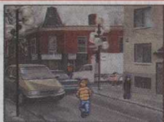
- A01 - Ste-Cath-Letourneux Victor Panin + 13th 24"x30" 375,00$