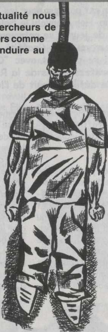
dessin par Mario Boisvert

Je vous offre cette information en étant bien installé devant mon ordinateur. Lorsque je passe ma main près de l'écran, je sens l'électricité statique s'amuser avec les poils de ma main et j'entends un bruit électrique. Si je passe trop de temps devant mon écran d'ordinateur, est-ce que j'augmente mes chances d'être dépressif et suicidaire?