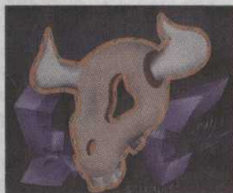
- 406 - El crâne 13th prophet 8"x10" 95,00 $