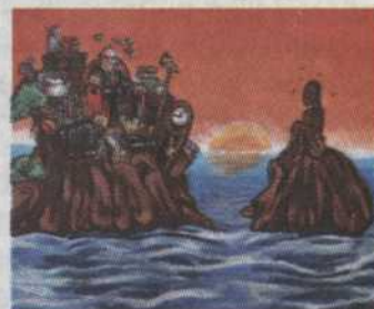
- 321 - L'accapuration Jean-François Lebel 16"x20" 195,00$