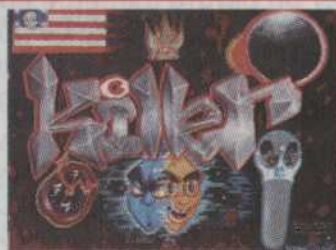
-417- killer Céus Pierre 16"x20" 195,00$