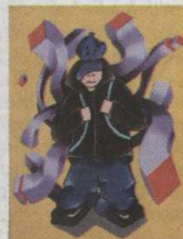
-133- Passant Carré 13th Prophet 8"x10" 75,00$