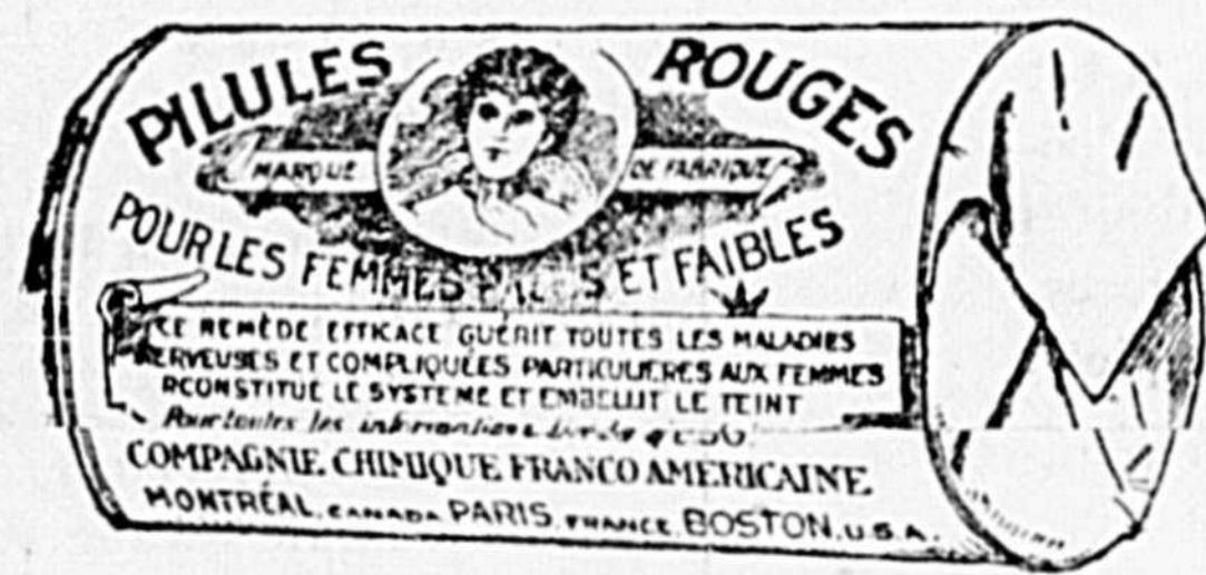
L'Étiquette est de papier blanc imprimé en rouge.

COMPAGNIE CHIMIQUE FRANCO-AMERICAINE, 274, rue St-Denis, Montréal.