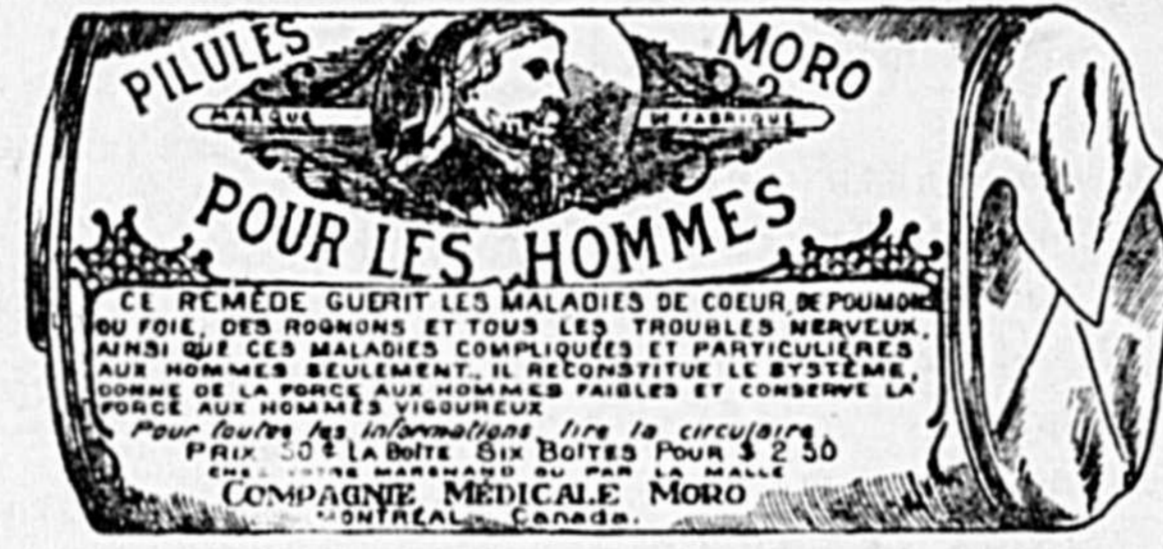
L'Etiquette est de papier blanc imprimé en bleu.

Fac-Simile exact d'une boîte de Pilules Moro.